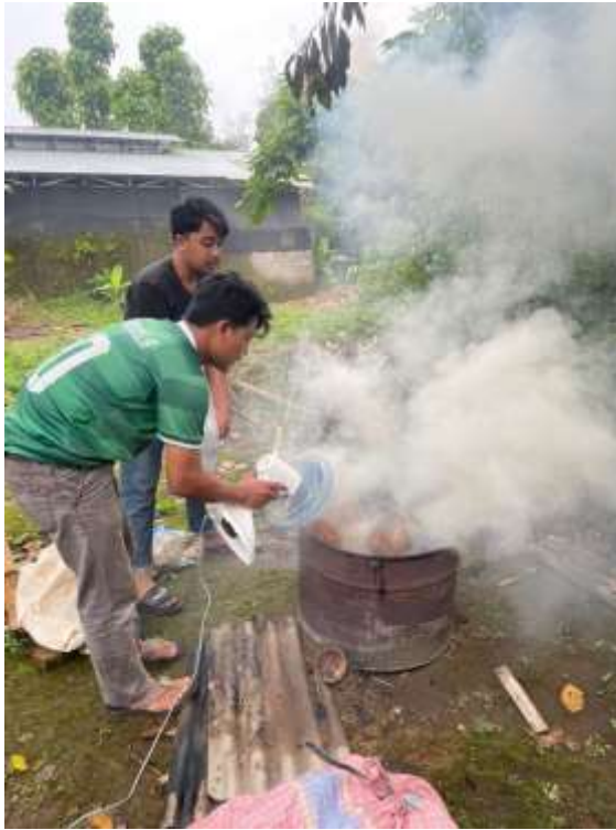
Lampiran 5. Pembakaran batok kelapa