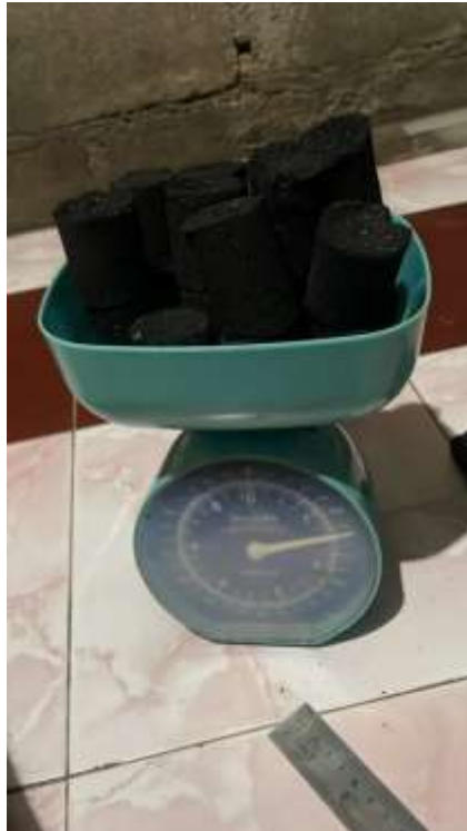
Lampiran 12. Penimbangan briket yang sudah jadi