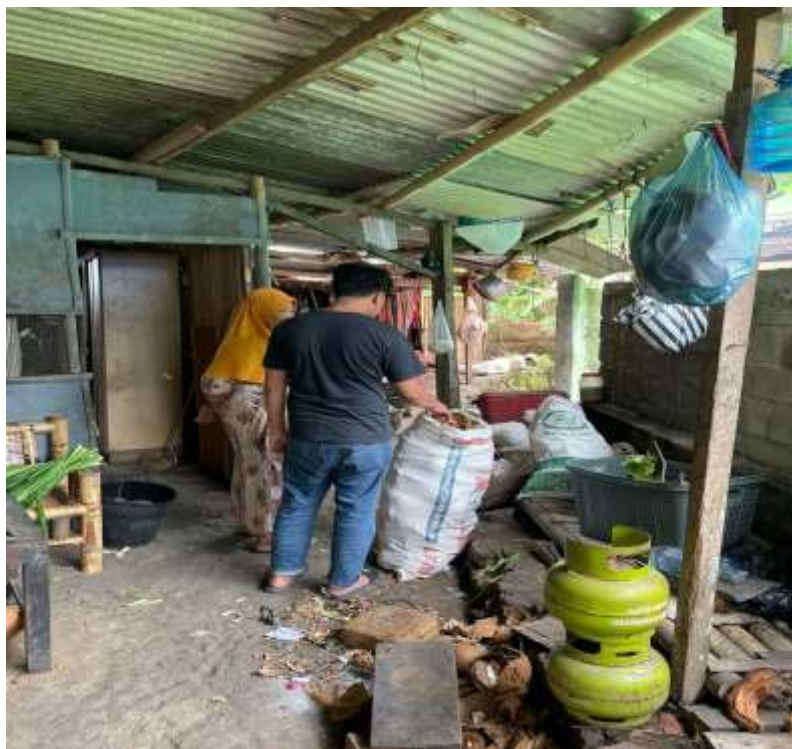
Gambar 2.4 Pembelian alat dan perlengkapan produksi

Pihak manufaktur sudah menyiapkan semua alat dan bahan yang dibutuhkan untuk bisnis briket ini. Sektor produksi kemudian menyetorkan apa yang dibeli kepada sang pencipta. Penulis kemudian melakukan penelitian tentang harga pasar untuk produk sejenis, harga material dan biaya tetap. Melihatnya, penulis menghitung harga produk yang diperlukan di toko online dan langsung di toko. Selanjutnya, anggota kelompok mendiskusikan alat dan bahan apa yang mereka putuskan untuk dibeli. Setelah alat dan bahan yang digunakan sudah memungkinkan, penulis mulai menghitung biaya produksi berdasarkan biaya tetap dan variabel.