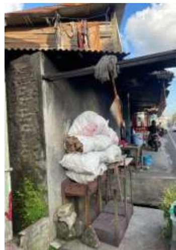
Gambar 1.1 Limbah batok kelapa pada usaha kelapa parut, rumah makan padang, dan toko kelontong

Dari pengamatan tersebut terdapat banyak limbah batok kelapa yang hanya diletakkan saja tanpa adanya pemanfaatan lebih lanjut. Limbah batok kelapa ini menumpuk dan jarang sekali orang yang mau membeli limbah batok