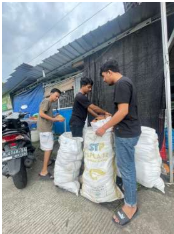
Lampiran 2. Pencarian batok kelapa