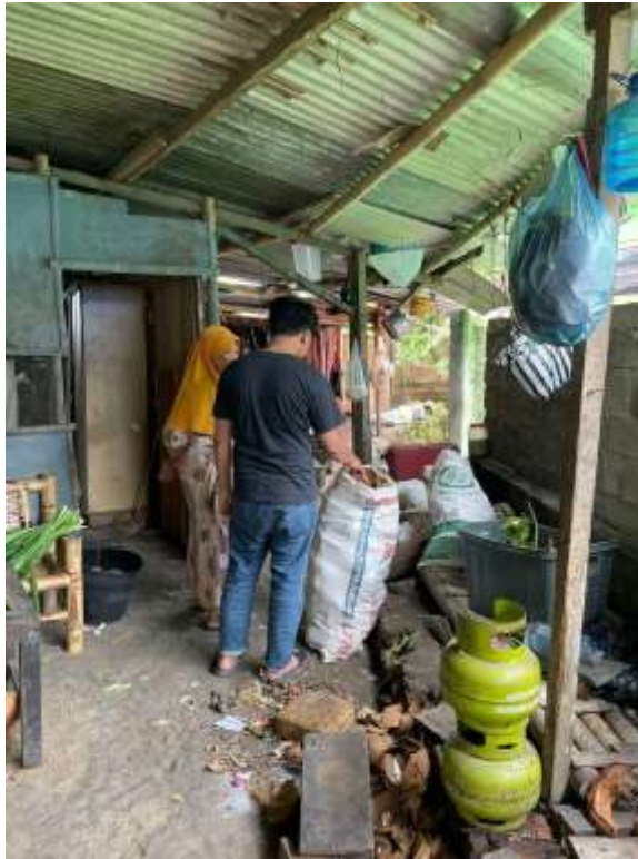
Lampiran 1. Proses pencarian batok kelapa