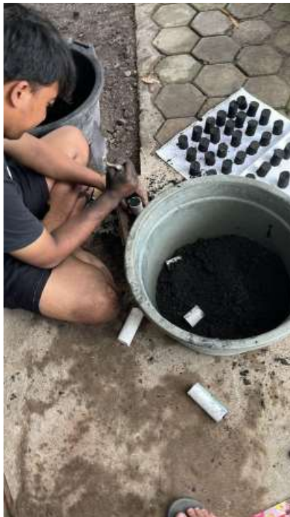
Lampiran 10. proses pencampuran adonan dan pencetakan