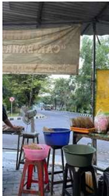
Gambar 1.3 Pedagang sate melakukan pembakaran menggunakan arang kayu

Riset pasar sendiri merupakan sebuah kegiatan yang dilakukan penulis untuk memahami situasi dan kondisi pasar dalam merespon produk briket arang kelapa. Dilakukannya riset pasar pada produk selain dapat membantu para pengusaha dalam mengidentifikasi seberapa besar produknya dapat diterima oleh masyarakat, tapi juga dapat dilakukan perbaikan dan inovasi sesuai dengan