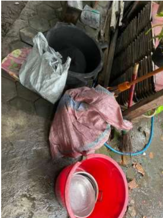
Lampiran 16. Alat pembuatan briket