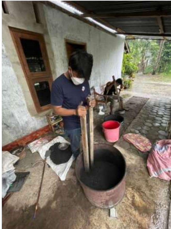
Gambar 2.6 Proses penumbukan arang menjadi serbuk arang

Kemudian penulis dan tim melakukan pencampuran semua bahan baku untuk di campur dengan merata supaya produk yang kami buat nantinya menjadikan produk yang bisa bersaing dengan kompetitor lainnya.