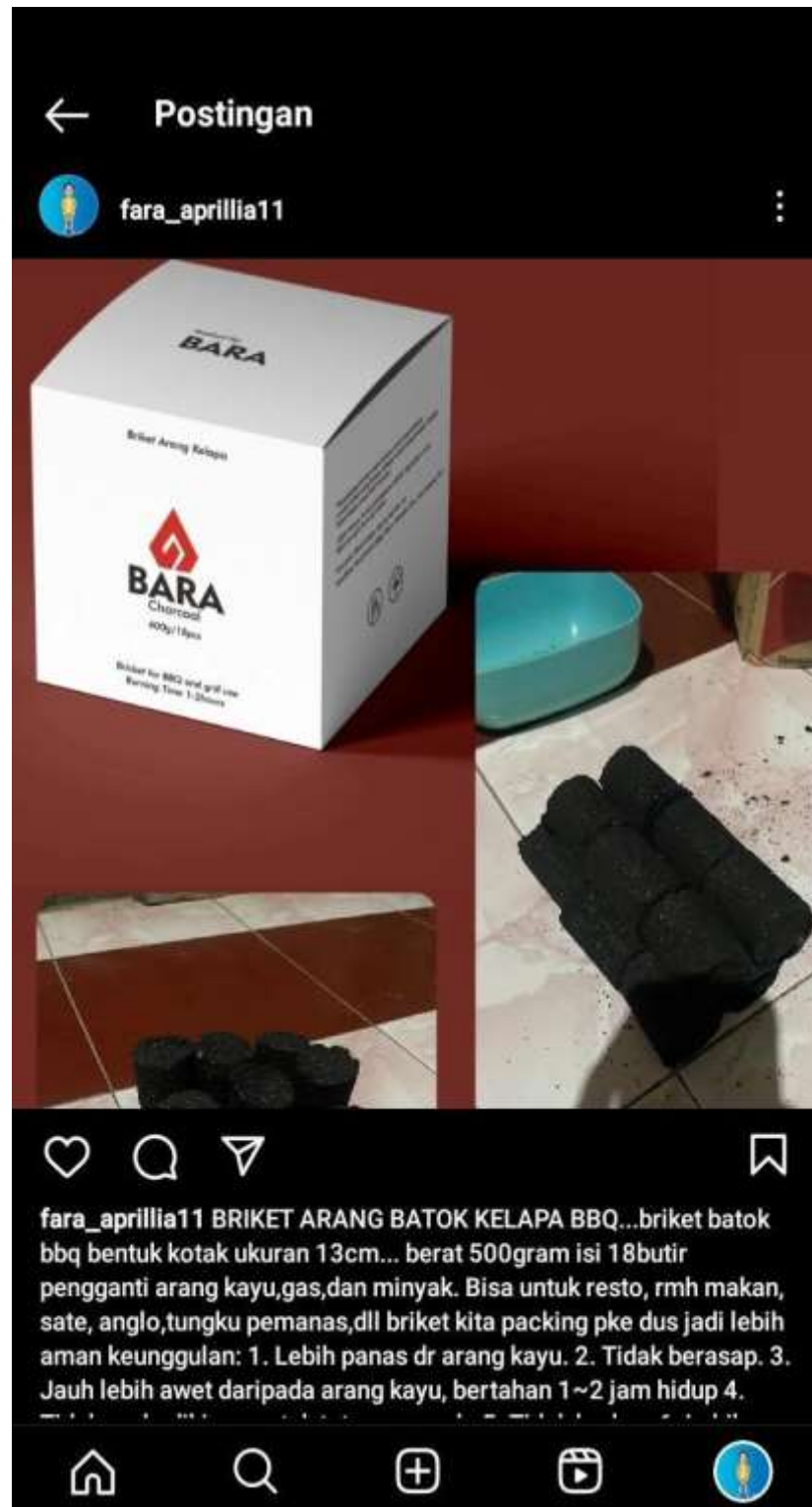
Gambar 2.11 Promosi Melalui Instagram