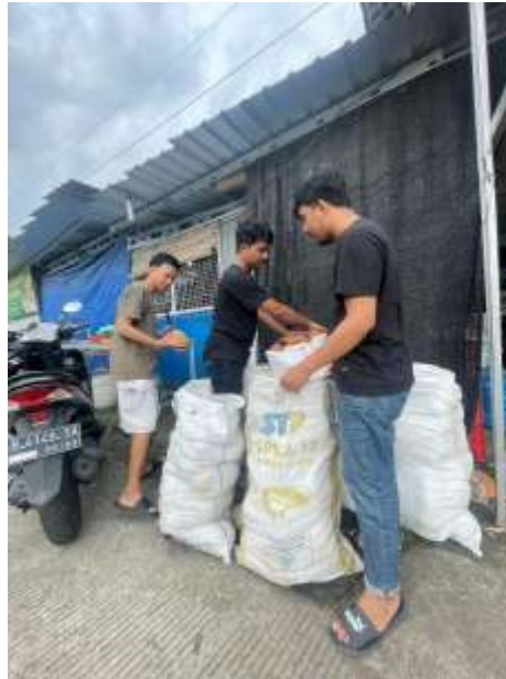
Gambar 2.2 Proses pencarian dan pembelian bahan baku

Dari gambar di atas penulis dan kelompok mencari bahan baku utama yaitu tempurung kelapa yang dimana sedikit susah untuk mencari bahan baku ini dikarenakan kelompok kami belum mengetahui dimana saja tempat untuk mendapatkan bahan baku ini.