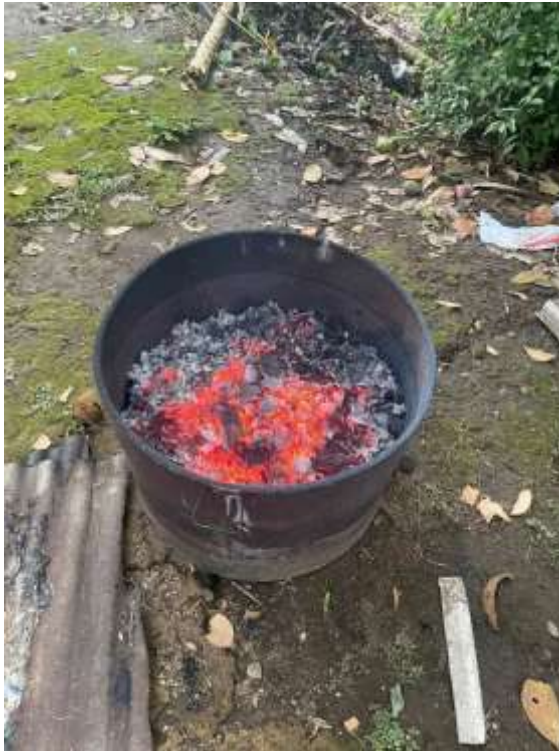
Lampiran 6. Hasil pembakaran batok kelapa