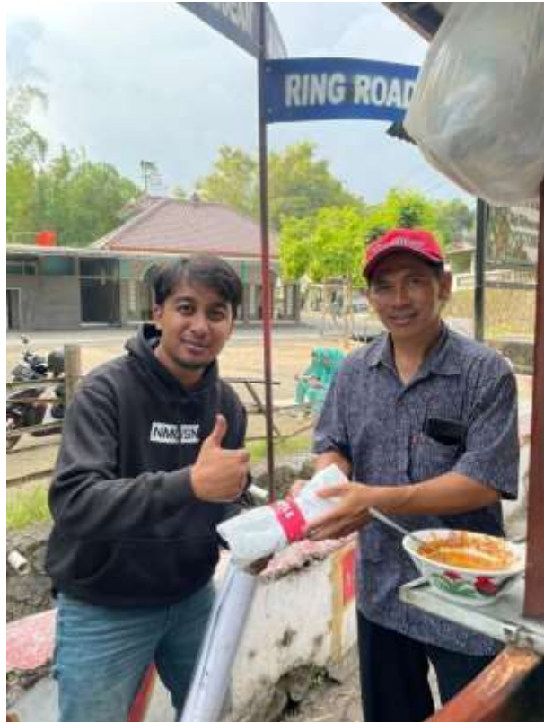
Lampiran 14. Penyerahan briket kepada penjual bakso untuk uji coba