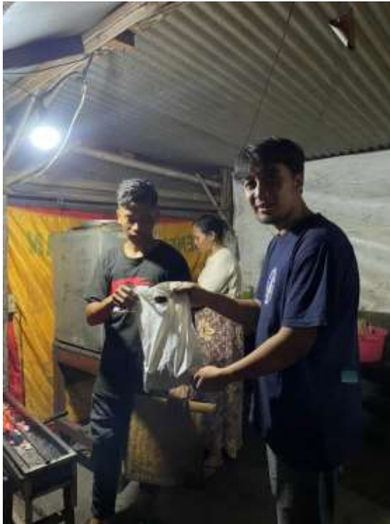
Lampiran 15. Penyerahan kepada penjual sate