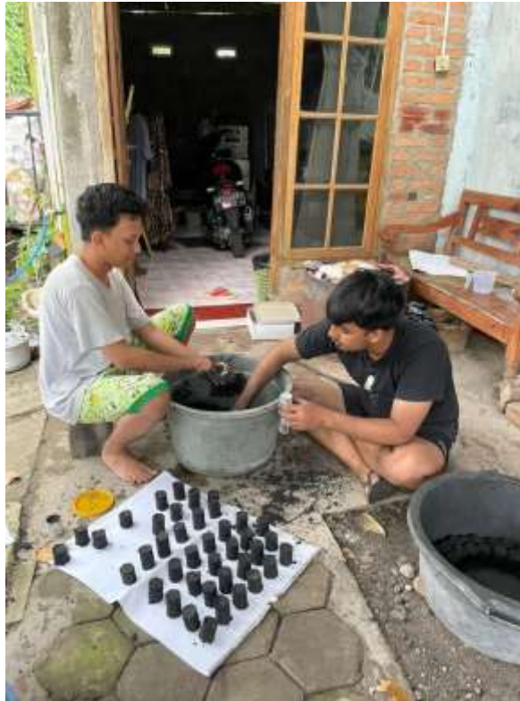
Lampiran 9. proses mencetak adonan briket