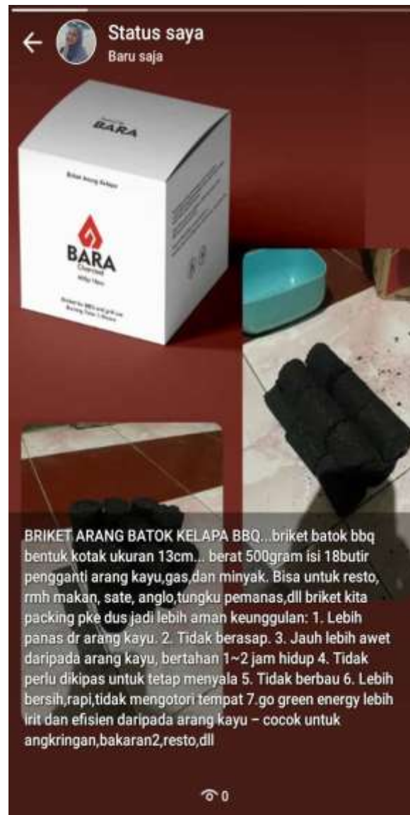
Gambar 2.9 Promosi Melalui WA