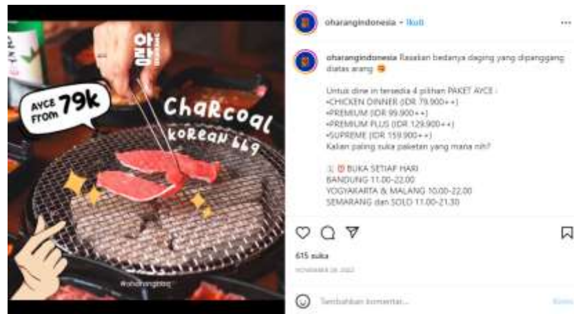
Gambar 1.4 Restaurant AYCE yang telah menggunakan briket charcoal dalam pembakaran