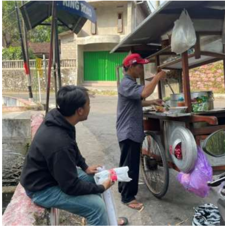
Lampiran 13. Proses menjajakan briket yang sudah jadi