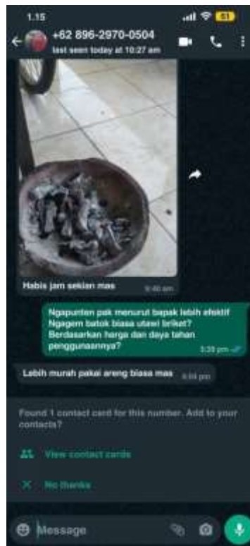
Lampiran 17. feedback dari penerima briket