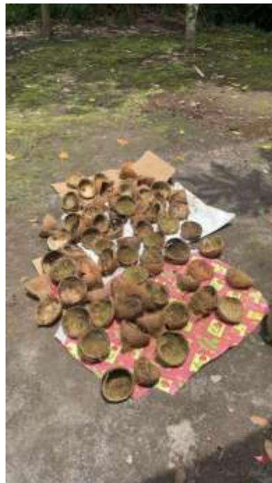
Lampiran 4. proses penjemuran batok kelapa