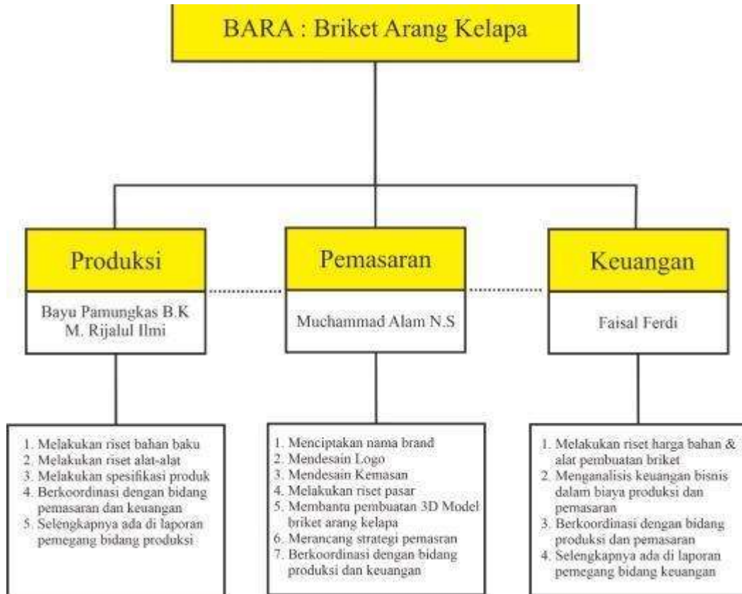
Tabel 2.1 Agenda Kerja Anggota Kelompok

Dalam aspek produksi dibagi menjadi dua orang dimana Bayu Pamungkas yang bertanggung jawab pada riset bahan baku serta melakukan dan menentukan spesifikasi produk sedangkan Rijalul ilmi dalam aspek produksi lebih bertanggung jawab pada alat-alat. Alam Nur bertanggung jawab pada aspek pemasaran dimana berbagai uraian kegiatan atau program kerja berfokus pada pembentukan brand serta melakukan riset pasar untuk menentukan strategi pemasaran. Faisal Ferdi sebagai pemegang bidang keuangan yang bertugas sebagai pengelolaan keuangan. Untuk masing-masing uraian program kerja di bidang produksi dan keuangan secara mendetail akan dijelaskan pada laporan masing-masing rekan tim penulis. Program kerja masing-masing bidang telah dirundingkan dan dikoordinasikan sebagai upaya