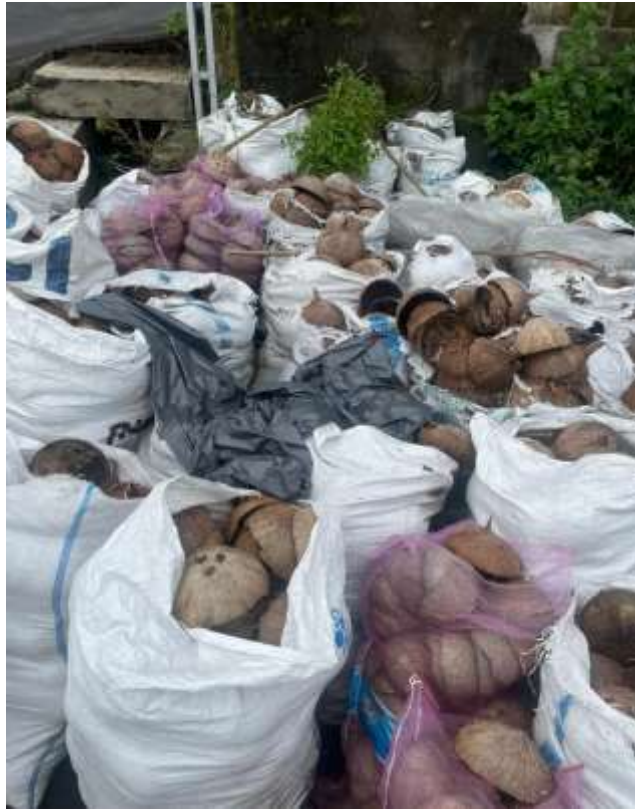
Lampiran 3. Batok kelapa sebelum di jemur