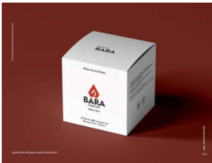
Gambar 2.3 Desain kemasan pada briket arang kelapa

Dari gambar di atas menunjukkan bahwa kemasan yang kami buat untuk briket yaitu berbentuk kubus dengan warna dasar putih dan mempunyai logo berwarna merah yang berkesan bersih dan simpel dengan logo di depan yang mampu memikat para calon customer.