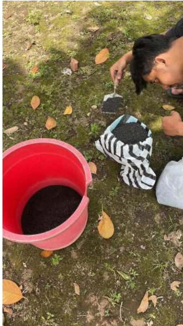
Gambar 2.8 Menimbang bahan untuk dikemas

Setiap adanya pemesanan, semua anggota kelompok bekerja sama dalam proses pengepakan produk briket arang kelapa. Penulis ikut serta membantu memasukkan serta penataan produk ke dalam kemasan serta menakar. Sedangkan anggota yang lain bertugas dalam merekatkan kemasan, serta mendokumentasikan kegiatan. Terkadang penulis juga melakukan pergantian pada saat pembuatan produk karena kami masih menggunakan proses secara manual yang membutuhkan tenaga yang berat.