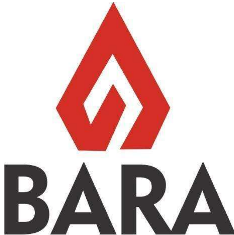
Gambar 2.1 Logo briket arang kelapa