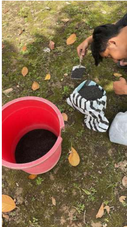
Lampiran 11. Penimbangan bahan baku