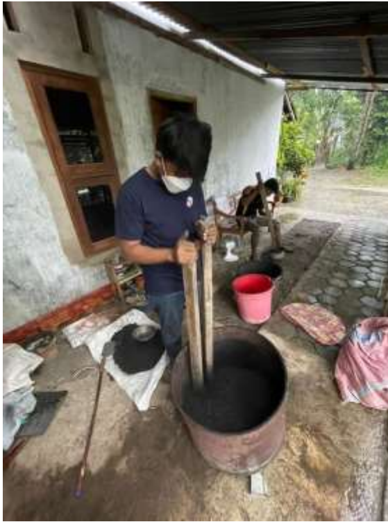
Lampiran 7. Proses penghalusan