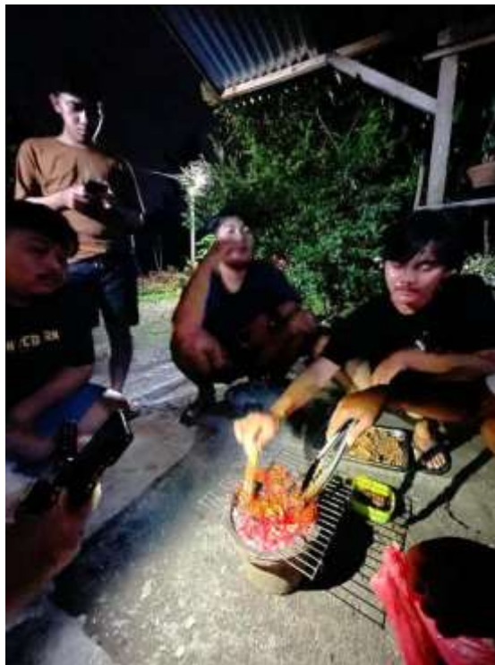
Gambar 1.2 Individu atau kelompok yang sedang melakukan bakar-bakar menggunakan arang kayu tradisional