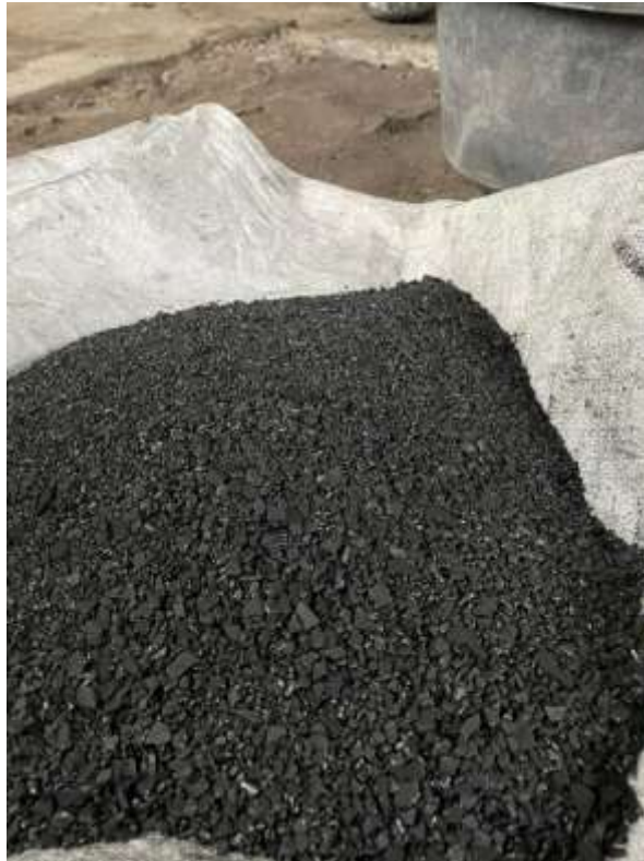
Lampiran 8. Hasil penumbukan batok kelapa