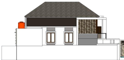
Gambar 1.4 Fasad Utara

Pada kategori ini nilai OTTV yang dihasilkan juga masih di ambang aman Konservasi Energi (Badan Standardisasi Nasional, 2000) yaitu \leq 45 \text{ W/m}^2 dengan nilai nilai OTTV Selatan sebesar 16.77 \text{ Watt/m}^2 , walaupun terdapat beberapa material transparan sebagai bukaan yang digunakan. Bukaan yang terdapat pada sisi timur ini diterapkan pada kamar tidur anak. Pertimbangan arsitek dalam penggunaan material transparan pada bukaan disisi timur didukung dengan adanya teritisan yang cukup untuk menghalau radiasi matahari pagi dan dengan dimensi bukaan yang sangat diminimalkan agar tidak menyerap kalor secara berlebihan.