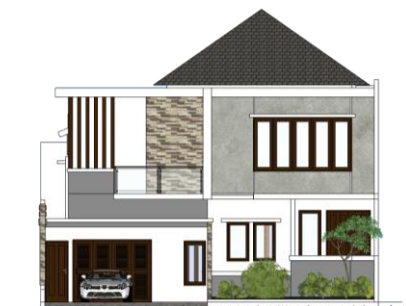
Gambar 1.2 Fasad Utara

Pada orientasi ini, selubung bangunan telah memenuhi standar nilai perpindahan termal dengan angka 25.57 W/m 2 . Adapun aspek penting yang mempengaruhi dari tingkat keberhasilan ini adalah karena penggunaan material transparan dan warna bahan yang memiliki nilai absorbtansi tinggi (abu-abu) diletakkan pada area utara yang tidak terkena paparan matahari langsung. Fasad pada bagian ini merupakan point of interest dari bangunan, sehingga diperlukan olahan-olahan fasad yang terdiri dari desain bukaan dan kombinasi berbagai warna bangunan. Dalam pemberian bukaan dengan material kaca transparan yang cukup lebar pada bagian depan, tidak lupa disertai dengan penambahan shading yang cukup mampu difungsikan untuk menghalau radiasi matahari dan menjaga agar bukaan dapat terproteksi dari pengaruh iklim tropis (hujan dan panas).