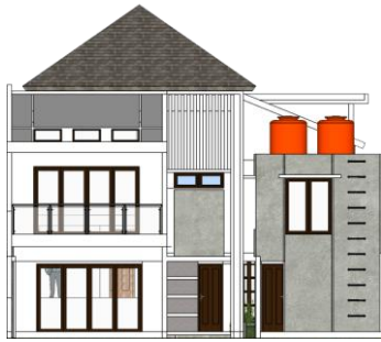
Gambar 1.3 Fasad Utara

lebih tinggi dibandingkan nilai OTTV utara. Pertimbangan arsitek menggunakan material kaca ini juga didukung dengan adanya teritisan/peneduh yang cukup Panjang, sehingga radiasi panas matahari dapat di minimalkan. Peletakkan material transparan yang besar pada bagian selatan juga dipertimbangkan dengan melihat jalur lintas matahari. Sehingga permainan material dengan nilai absobtansi tinggi masih dapat di maksimalkan.