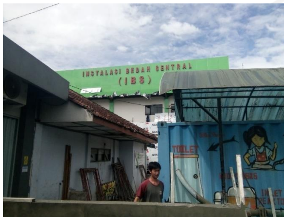
Gambar 5.3 Akses Jalan Proyek