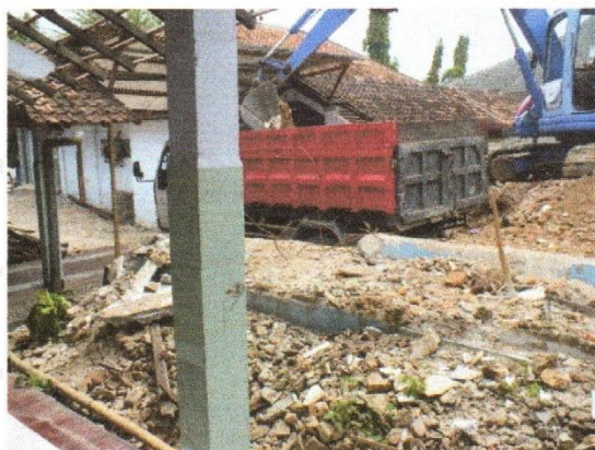
Gambar 5.4. Akses Jalan Proyek setelah dibuat jalan baru