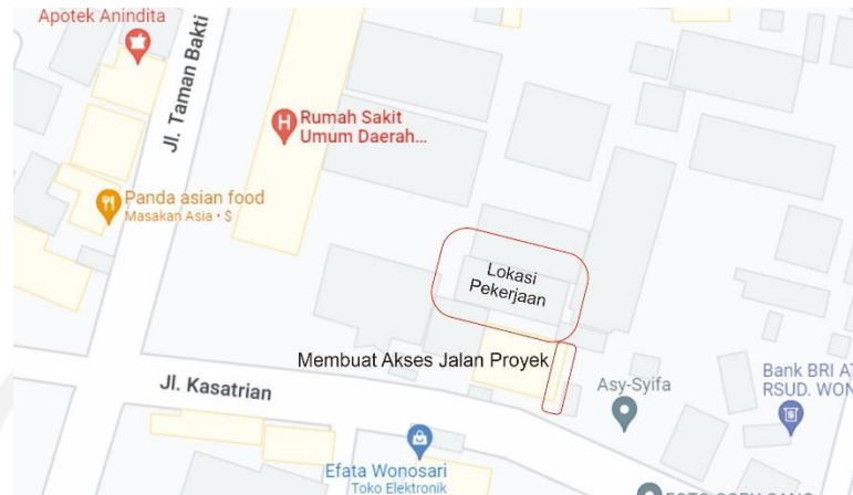
Gambar 5.5. Peta Akses Jalan Proyek

Tindakan pengendalian risiko keterlambatan pengiriman material, risiko ini disebabkan oleh kondisi lokasi yang sulit dijangkau, lokasi yang sempit oleh bangunan existing , sehingga material tidak ada tempat Gudang di proyek. Kontraktor pelaksana berupaya untuk membuat jadwal pengiriman barang, dan juga pengerjaan baja dilokasi lain bukan dilokasi pekerjaan, sehingga pengiriman material sudah bukan material mentah, tetapi tinggal dirakit dilokasi pekerjaan.