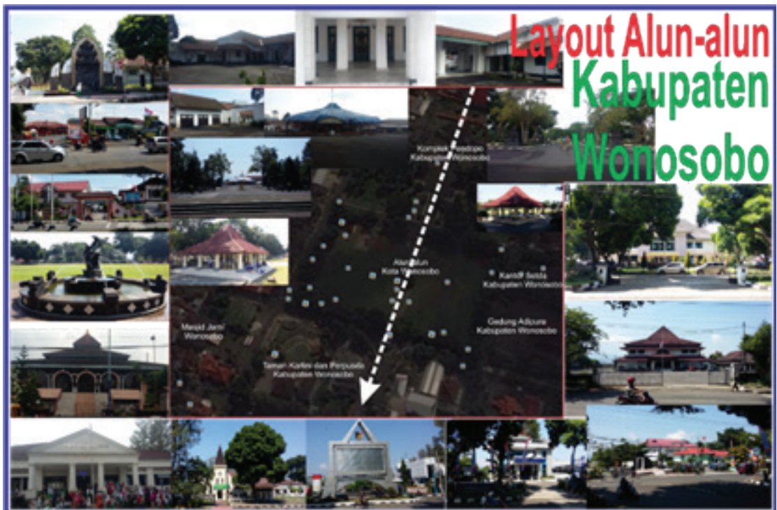
Gambar 5. Layout Alun-alun Kabupaten Wonosobo

Wonosobo pada pusat pemerintahannya memiliki alun-alun kota, seperti halnya kota-kota di Pulau Jawa lainnya, keberadaan Alun-alun tidak lepas dengan adanya pendopo kabupaten sebagai elemen utama. Pendopo Kabupaten Wonosobo berada pada sisi utara alun-alun menghadap ke selatan. Selain Pendopo Kabupaten juga terdapat elemen penyusun Tata Ruang Kota Jawa lainnya berupa masjid, penjara maupun pasar. Sebagai unsur-unsur yang selalu ada pada setiap alun-alun di Pulau Jawa hingga saat ini, hal inilah yang terjadi perbedaan tentang letak masjid di area alun-alun Kabupaten Wonosobo yang tidak tepat di sebelah baratnya, tetapi agak bergeser ke selatan.