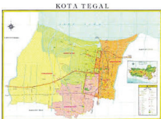
Gambar 3. Peta Kota Tegal

atasan langsung dengan Laut Jawa di sebelah utara, Kabupaten Tegal di sebelah selatan dan timur, serta Kabupaten Brebes disebelah barat. Luas Wilayah Kota Tegal, relatif kecil yaitu hanya 0,11 % dari luas Provinsi Jawa Tengah. Secara Administrasi Wilayah Kota Tegal terbagi dalam 4 Kecamatan dan 27 Kelurahan, dengan batas administratif sebagai berikut: Sebelah Utara berbatasan dengan Laut Jawa, Sebelah Timur dan Selatan berbatasan dengan Kabupaten Tegal, Sebelah Barat berbatasan dengan Kabupaten Brebes. Berdasarkan Peraturan Pemerintah Nomor 7 Tahun 1986 tentang perubahan Batas Wilayah Kotamadya Daerah Tingkat II Tegal dan Kabupaten Daerah Tingkat II Tegal, Luas Wilayah Kota Tegal adalah 38,50 Km 2 atau 3.850 Hektar. Namun demikian secara Defacto luas wilayah Kota Tegal mengalami perubahan sejak tanggal 23 Maret 2007 dengan ditetapkannya Peraturan Pemerintah Nomor 22 Tahun 2007 tentang Perubahan Batas Wilayah Kota Tegal dengan Kabupaten Brebes Provinsi Jawa Tengah di Muara Sungai Kaligangsa., sehingga luas wilayah Kota Tegal menjadi 39,68 Km 2 atau 3.968 Hektar.