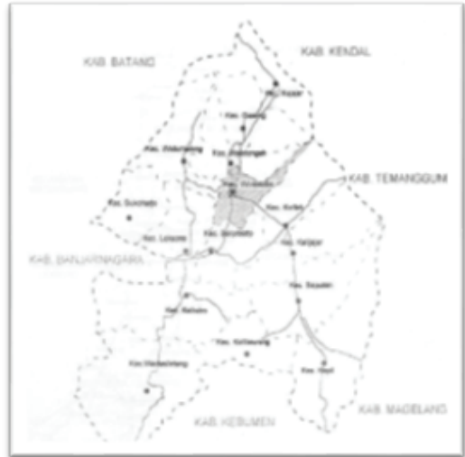
Gambar 1. Peta Kabupaten Wonosobo

Kota Tegal merupakan salah satu Kota di Provinsi Jawa Tengah dengan luas wilayah keseluruhan 39,5 km 2 dan terbagi menjadi 4 Kecamatan dan 27 Desa yang berba-