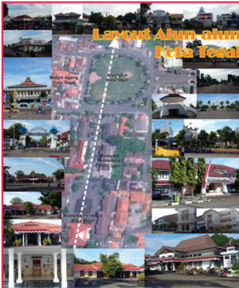
Gambar 4. Peta Alun-alun Kota Tegal dan Kabupaten Wonosobo