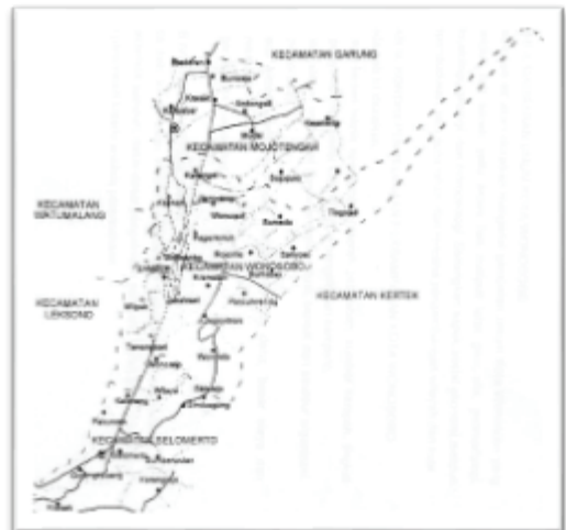
Gambar 2. Peta Kota Wonosobo