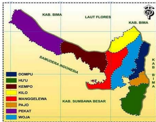
Gambar 1. Peta Wilayah Kabupaten Dompu (BPS Kabupaten Dompu, 2016B)

Provinsi Nusa Tenggara Barat (NTB) merupakan salah satu provinsi Indonesia yang memiliki potensi wisata yang beragam dan sangat indah. Saat ini provinsi NTB menjadi salah satu daerah tujuan wisata favorit bagi para wisatawan lokal maupun mancanegara, karena memiliki keindahan alam dan seni serta budaya yang beragam yang tersebar di seluruh daerah yang ada di provinsi NTB salah satunya adalah Kabupaten Dompu.