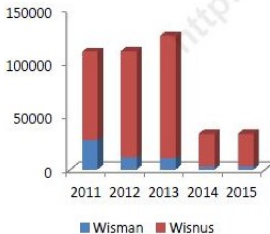
Gambar 3. Grafik Jumlah Wisatawan Nusantara dan Mancanegara yang berkunjung ke Dompu Tahun 2011-2015 (BPS Kabupaten Dompu, 2016B)

Namun dalam kurun waktu 5 (lima) tahun terakhir, jumlah kunjungan wisatawan di Kabupaten Dompu mengalami penurunan yang sangat signifikan. Tercatat pada tahun 2015 terjadi penurunan kunjungan wisatawan yang sangat signifikan dengan jumlah kunjungan wisatawan sebanyak 33.378 orang. (BPS Kabupaten Dompu, 2016B)