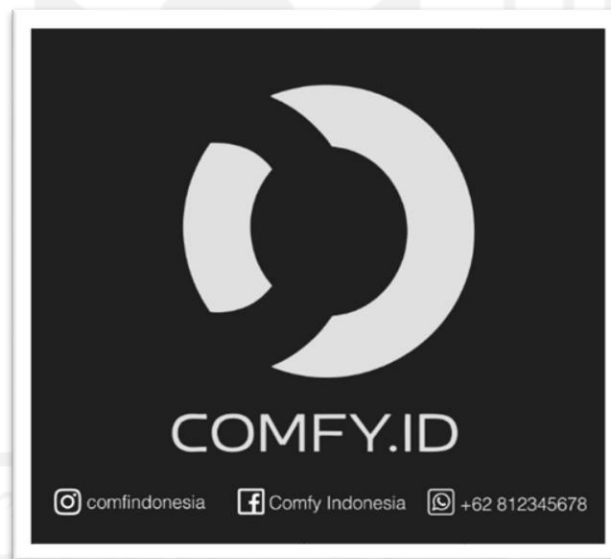
Gambar 1.1 Logo Comfy.id

Dalam menjalankan tugas akhir perintisan bisnis ini, penulis telah mempunyai anggota kelompok yang mempunyai peran dan tugas masing-masing untuk menjalankan bisnis ini. Dalam menentukan tugas dan bagian masing-masing yang sesuai dengan kriteria bisnis COMFY.ID sehingga dapat menjalankan bisnis yang mumpuni dan