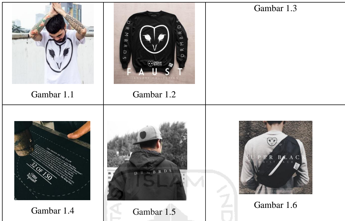
Tabel 1.1, Unit Analisis Penelitian