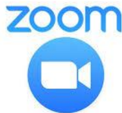
Gambar 2.1 : Aplikasi Zoom

untuk videoconference, bisa dengan gampang dapat di download pada perangkat Computer dan Smart Phone .