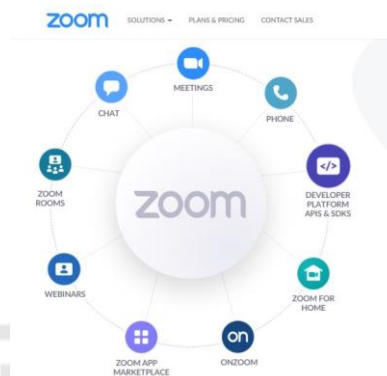
Gambar 2.2 : Fungsi Aplikasi Zoom