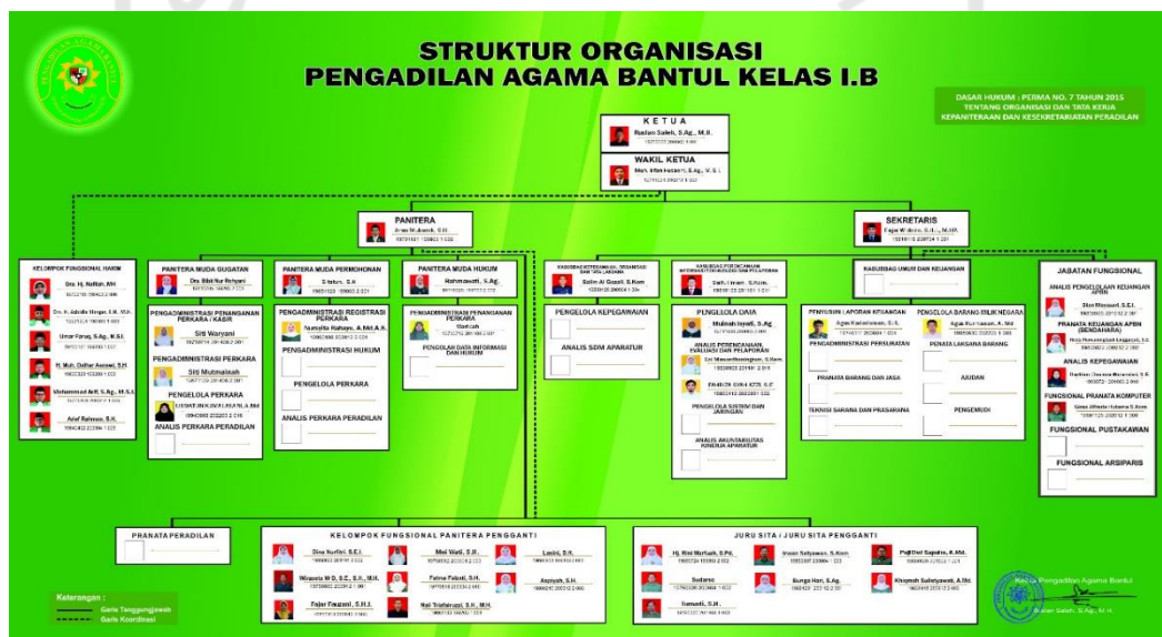
Gambar 4.1 : Struktur Organisasi Pengadilan Agama Bantul