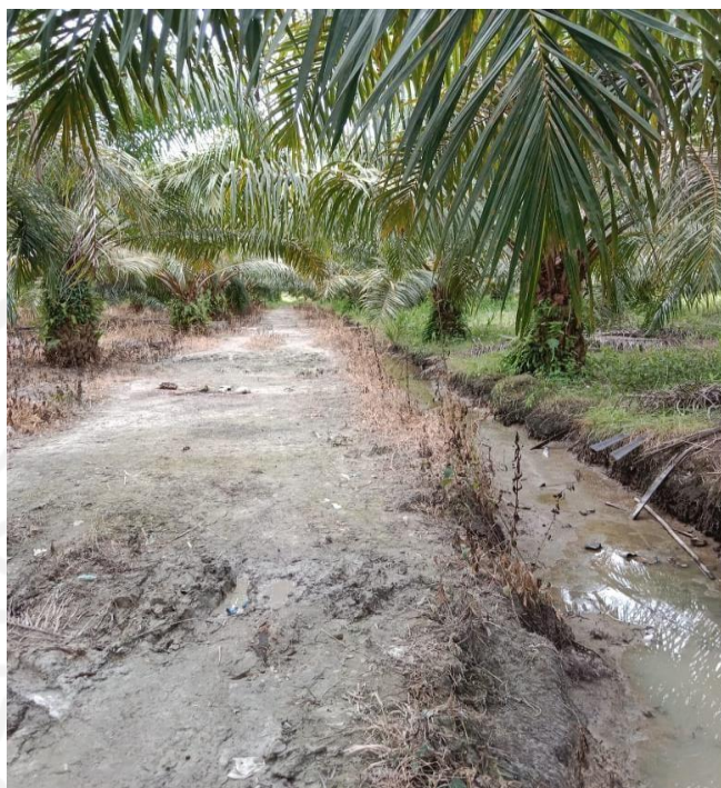
Gambar 6 : Kebun Sawit tempat Yogi bekerja

Selanjutnya Surya menjelaskan hal itu tidak membuatnya menilai adanya smartphone adalah hal negatif, bahkan Surya mengaku sangat terbantu dengan kehadiran smartphone dan smartphone, karena dengan kerja sampingannya sebagai agen motor tentunya dia bisa juga menikmati pekerjaan secara online.