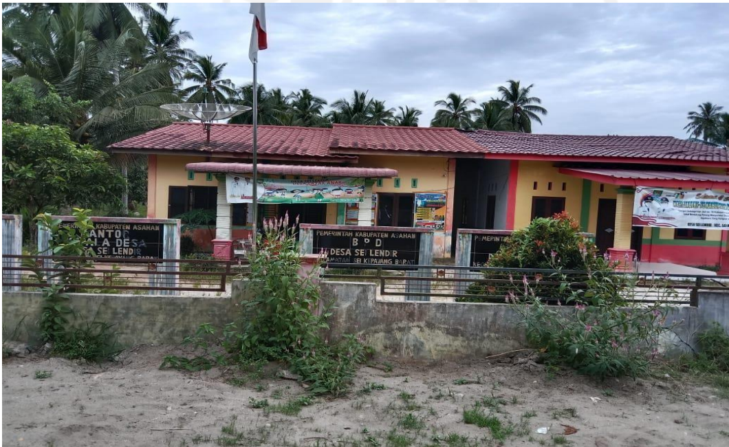
Gambar 1 : Kantor Desa Sei Lendir