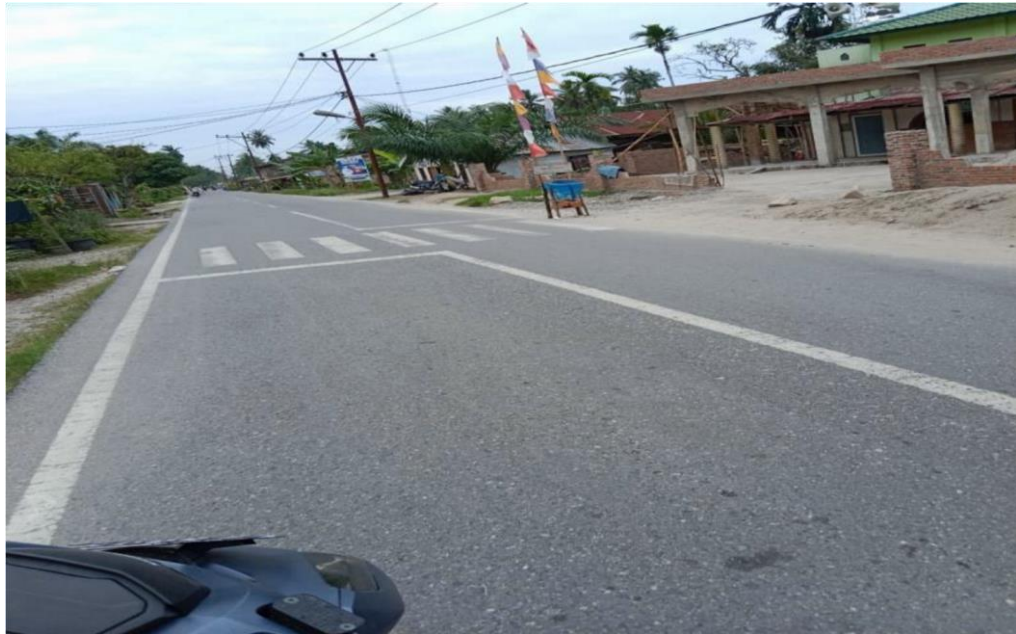
Gambar 2 : Jalan Lintas Desa Sei Lendir

Kemudian pada sekitar tahun 2015 didirikan sebuah tower jaringan di desai Sie Lendir, dari situlah masyarakat mulai menggunakan smartphone bahkan diantara mereka sudah mulai ada yang memiliki smartphone. Berikut adalah pemaparan dari informan penelitian melalui proses pengamatan dan wawancara, hasilnya sebagai berikut: