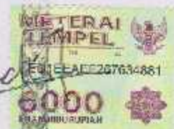
Rachmad Fauzan 12511367