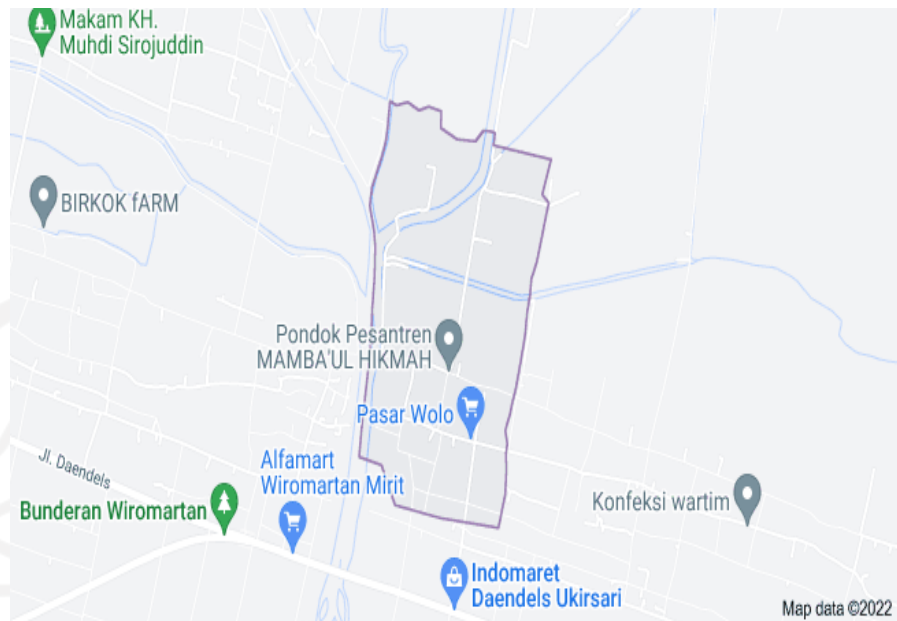
Gambar 4.1 Peta Desa Nambangan Kecamatan Grabak Kabupaten Purworejo

Mata pencaharian sebagian besar masyarakat Desa Nambangan yaitu sebagai petani, buruh tani, buruh swasta. Karena wilayahnya yang subur Desa Nambangan dapat ditanami berbagai macam tanaman seperti palawija dan buah-buahan produk unggulannya di antara lain pepaya California, jambu kristal, padi dan jagung.