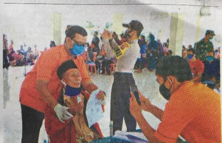
Seorang penerima BST sedang diambil gambarnya, warga lain antre berdesak-desakan.

untuk mencapai kebahagiaan dunia dan akhirat. Peringatan Kuzul Qursan menjadi momentum untuk memahami pesan Al Quran dan mengamalkannya sebagai pedoman dalam membangun peradaban yang unggul, maju dan mulia. Tabahay . (Ati)-2