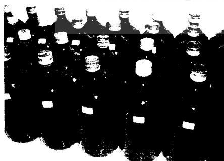
Botol sampel air limbah