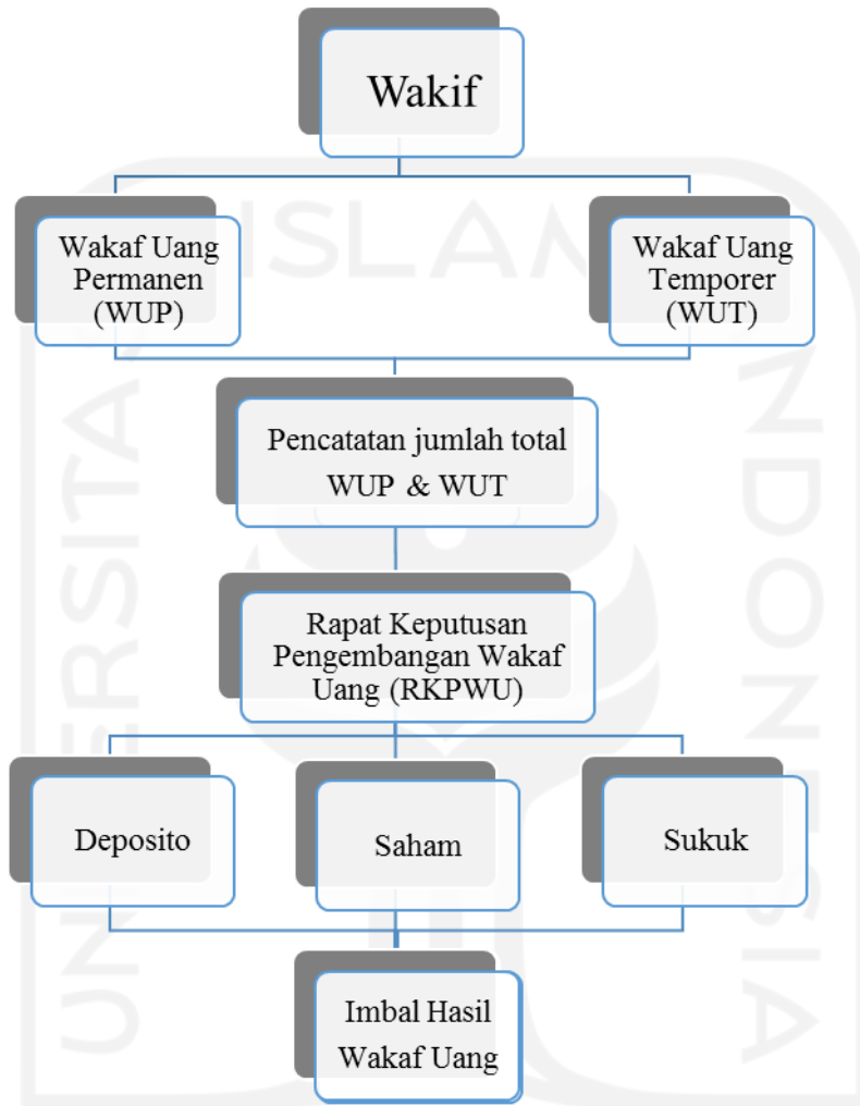
Gambar 1 Skema Pengembangan Wakaf Uang Lembaga Wakaf Uang UNISIA