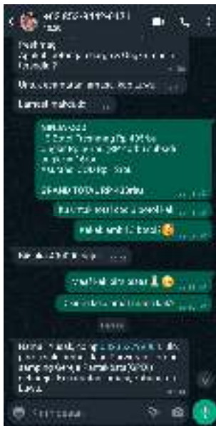
Gambar 3.2.2.2 Proses Perbincangan Kepada Leads Menggunakan Whatsapp Business

Dalam menjalankan kegiatan penjualan, cs akuisisi maupun CRM menggunakan aplikasi Whatsapp atau Whatsapp Business untuk melakukan kegiatan penjualan pada tahap perbincangan, dan input data pemesanan.