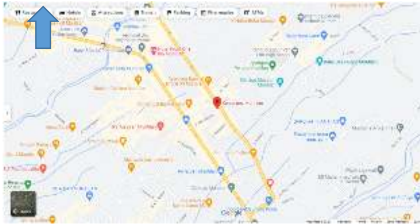
Gambar 1 Peta Lokasi Magang