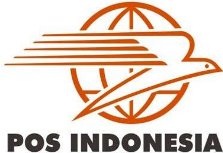
Gambar 2 Logo PT. Pos Indonesia