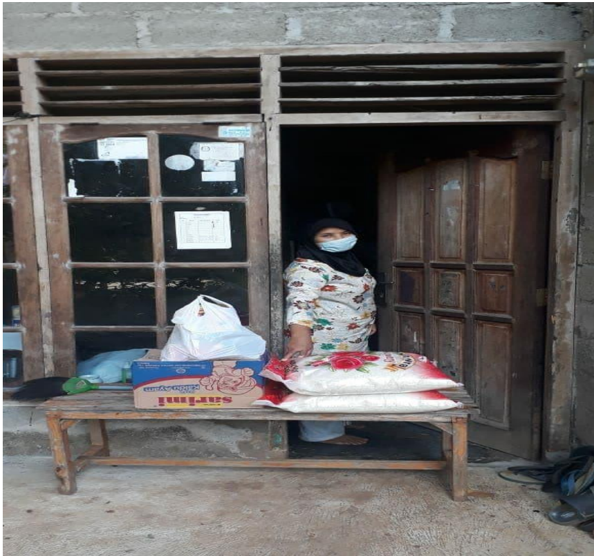
Gambar 4.1, Warga Dusun Rajek Lor yang tengah menerima bantuan berbentuk bahan pangan untuk membantu krisis ekonomi yang tengah terjadi akibat pandemi (foto tanggal 15 Juni 2020)

juga banyak yang rumah tangganya diusulkan untuk mendapatkan Bantuan Sosial Tunai atau BST yang didapatkan dari Dinas Sosial ataupun dari pemerintah.