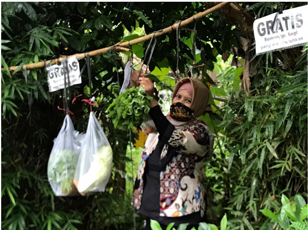
Gambar 4.3, “Chantelan” Sebagai Bentuk Gotong Royong dan Membantu Ekonomi Warga (foto tanggal 14 Juni 2020)