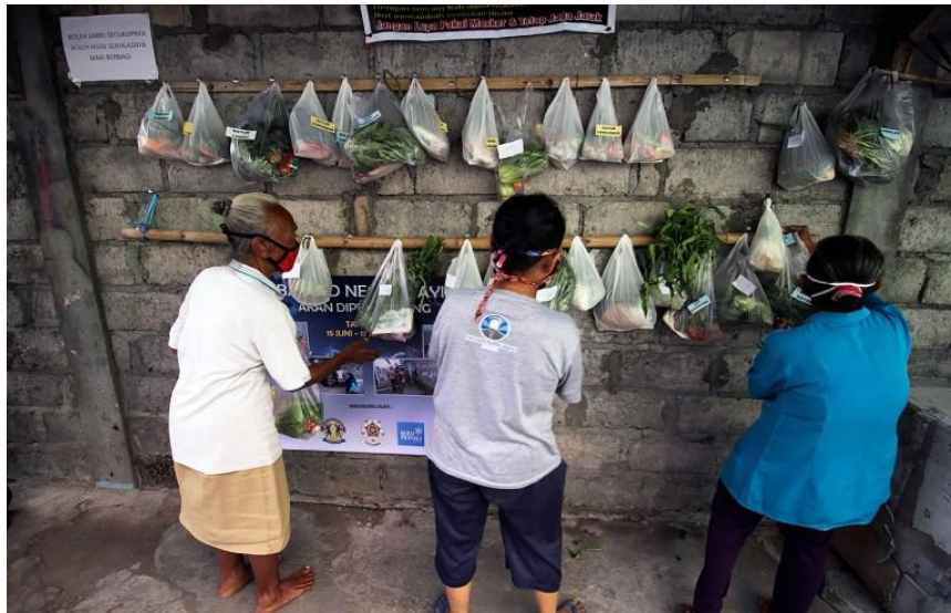
Gambar 4.2, Masyarakat yang Mengambil Bahan Makan yang telah Disediakan dalam Sedekah “Chantelan” (foto tanggal 15 April 2020)

memberikan pertolongan tanpa harus menunggu kaya terlebih dahulu. Pada usianya yang sudah senja dan bahkan tidak produktif lagi, ia telah menunjukkan rasa kepedulian yang tinggi atas penderitaan yang dialami oleh orang lain sebagai dampak dari adanya pandemi Covid-19.