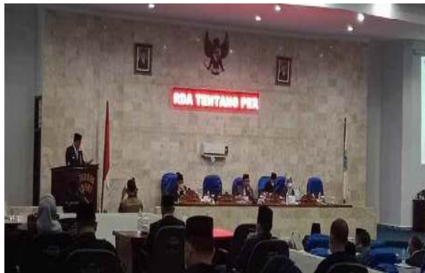
Gambar 3.3 Rapat Paripurna

Di Sekretariat DPRD juga pegawai Pns sering melakukan perjalanan DL(Dinas Luar) seperti konsultasi, studi banding, dengan judul yang diambil. Di Sekretariat DPRD juga sering melakukan rapat seperti rapat paripurna, rapat komisi, rapat banggar, dan rapat banmos.