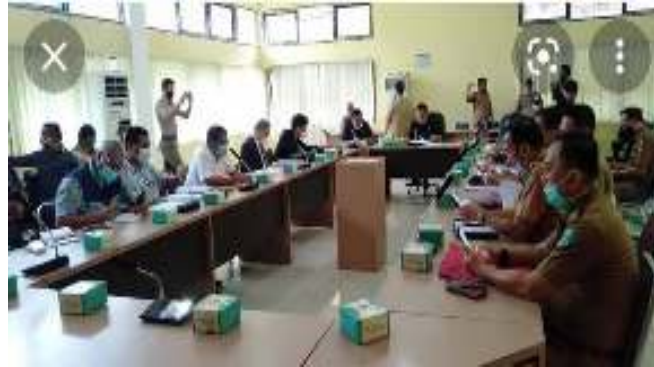
Gambar 3.5 Rapat Komisi