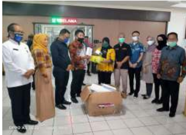
Gambar 3.6 Rapat Bansom