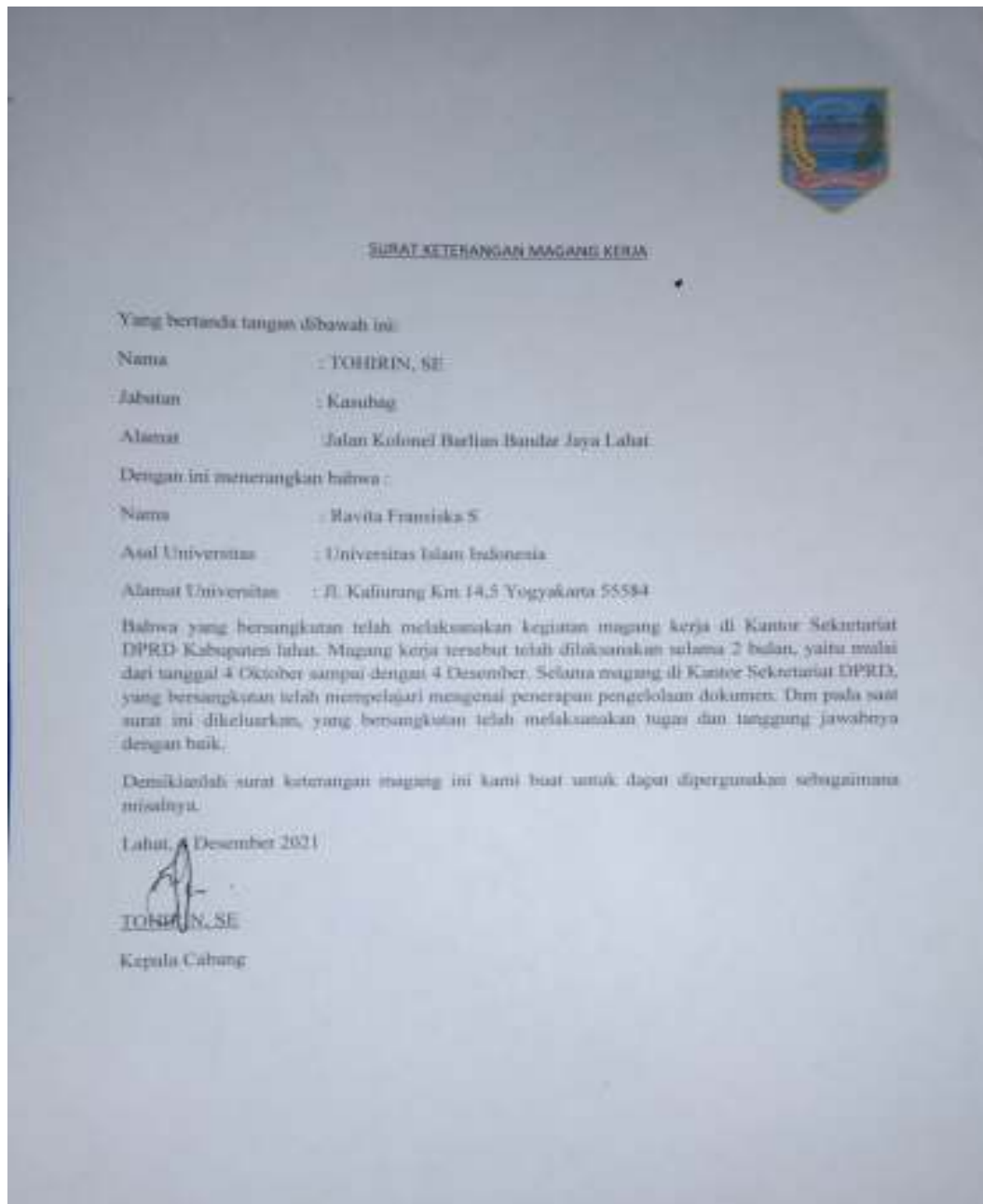
Lampiran 1 Surat Keterangan Magang