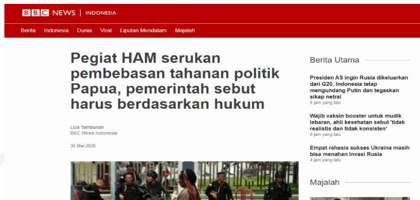
Gambar 9 - Respon Indonesia terkait tapol Papua