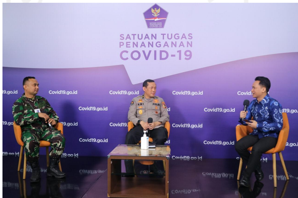
Gambar 6 - Sinergitas TNI-Polri dalam penanganan covid-19