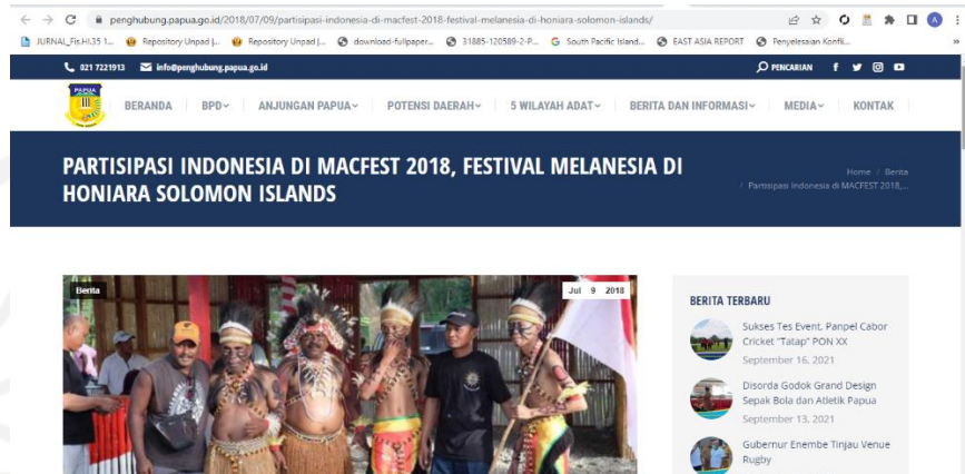
Gambar 2 - Pemberitaan dari pemerintah Papua Barat