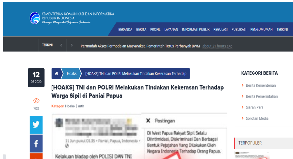
Gambar 7 - Klarifikasi Indonesia terkait propaganda OPM