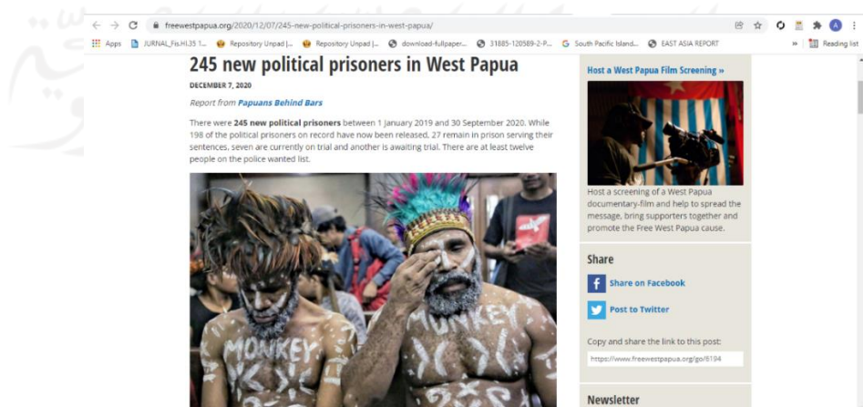
Gambar 8 - Penahanan terhadap 245 tapol Papua