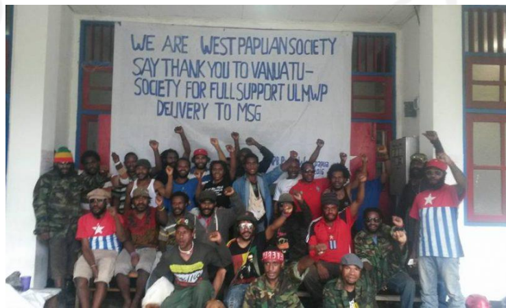
Gambar 10 - Sejumlah massa yang mengikuti gerakan sosial