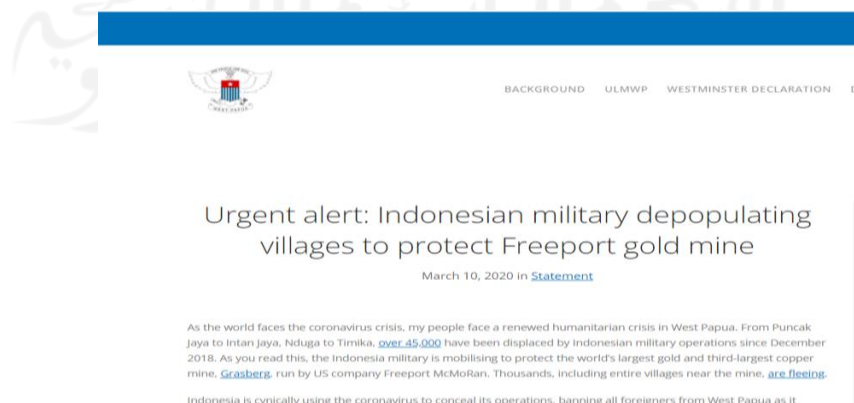
Gambar 3 - Propaganda terkait PT. Freeport

Isu selanjutnya yang dibingkai ulang adalah mengenai PT. Freeport, dalam pemberitaannya melalui website ulmwp.org (ulmwp 2020), ULMWP mengatakan bahwa adanya pengusiran yang dilakukan oleh militer Indonesia terhadap penduduk desa disekitar PT. Freeport. Dalam pemberitaannya, mereka mengatakan bahwa Indonesia memanfaatkan pandemi covid-19 sebagai upaya untuk menyembunyikan operasinya untuk mengurangi populasi desa, mereka juga menyebutkan bahwa militer memaksa penduduk desa untuk pergi ke hutan tanpa tujuan yang jelas, sehingga berakhir mati kelaparan. Mereka juga menyebutkan ada sekitar 700 tentara militer baru yang dikirimkan untuk menjalankan misi ini.