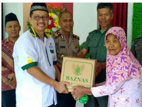
Baznas Melakukan Pentasyarufan ZIS dengan membagi Sembako