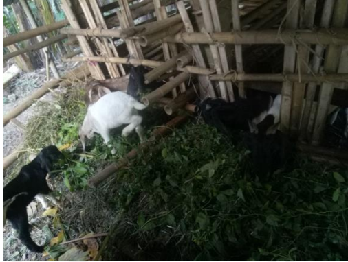
Tempat Ternak Kambing