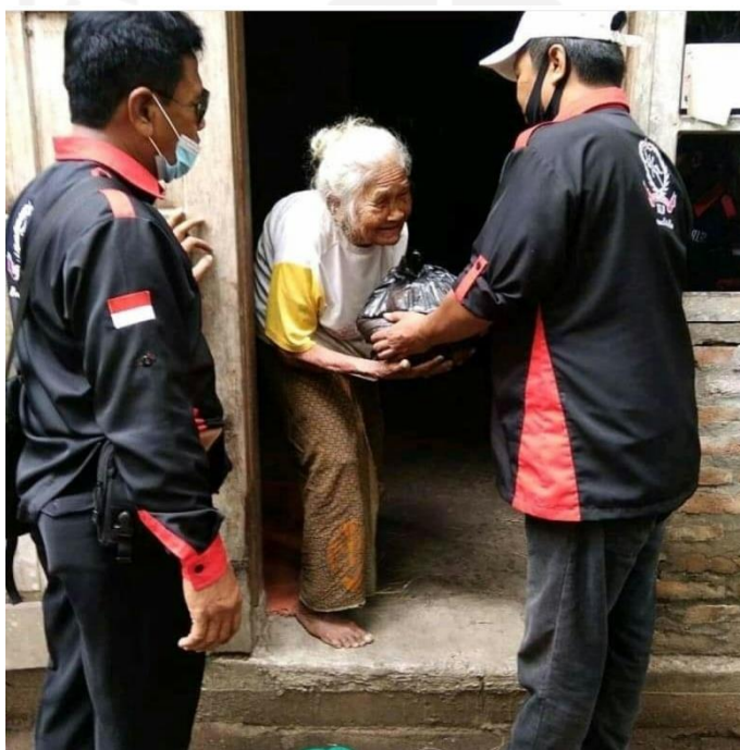
Pembagian Sembako dari Baznas Bantul yang dibantu oleh para relawan di Kabupaten Bantul