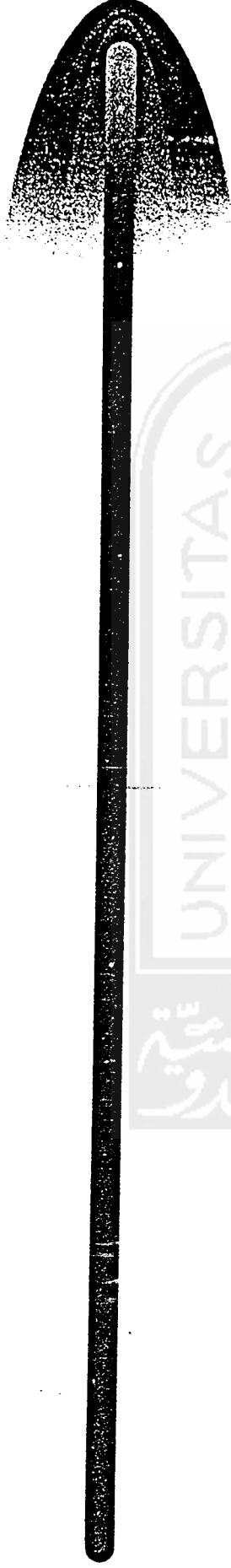
Pemetaan Kasus NAPZA di DIY tahun 1999/2000