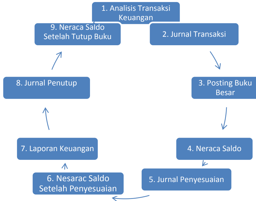
Gambar 2.4 Siklus Akuntansi