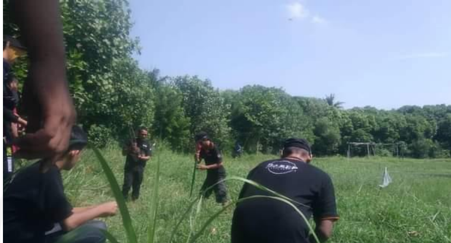
(Kegiatan alam/rescue Komunitas Barep)