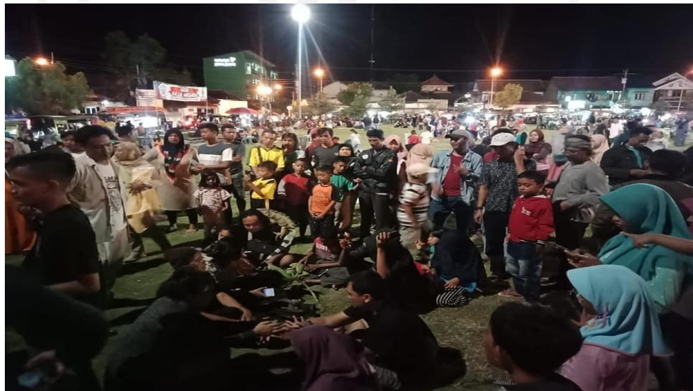
(Gathering Komunitas Barep di alun-alun paseban Bantul)

Kegiatan rutin Komunitas Barep (Bantul Reptil) ini setiap 1 atau 2 minggu sekali pada jumat dan minggu melaksanakan kumpul gathering. Dengan tujuan silaturahmi dengan para pecinta reptil di Bantul dan mengenalkan serta mengedukasi reptil kepada masyarakat, merubah paradigma masyarakat tentang reptil yang menakutkan menjadi suka, karena reptil bisa dijadikan sahabat.