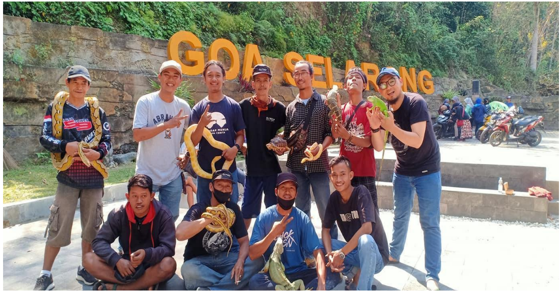
(Gathering Komunitas Barep di Goa Selarong)