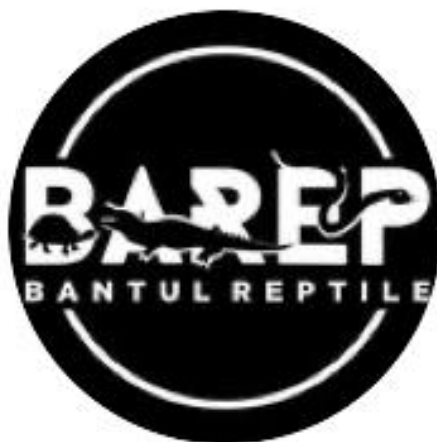
Logo Komunitas Barep (Bantul Reptil)