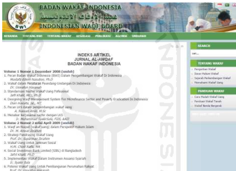
Gambar 4.4 Halaman Jurnal Al-Awqaf Badan Wakaf Indonesia