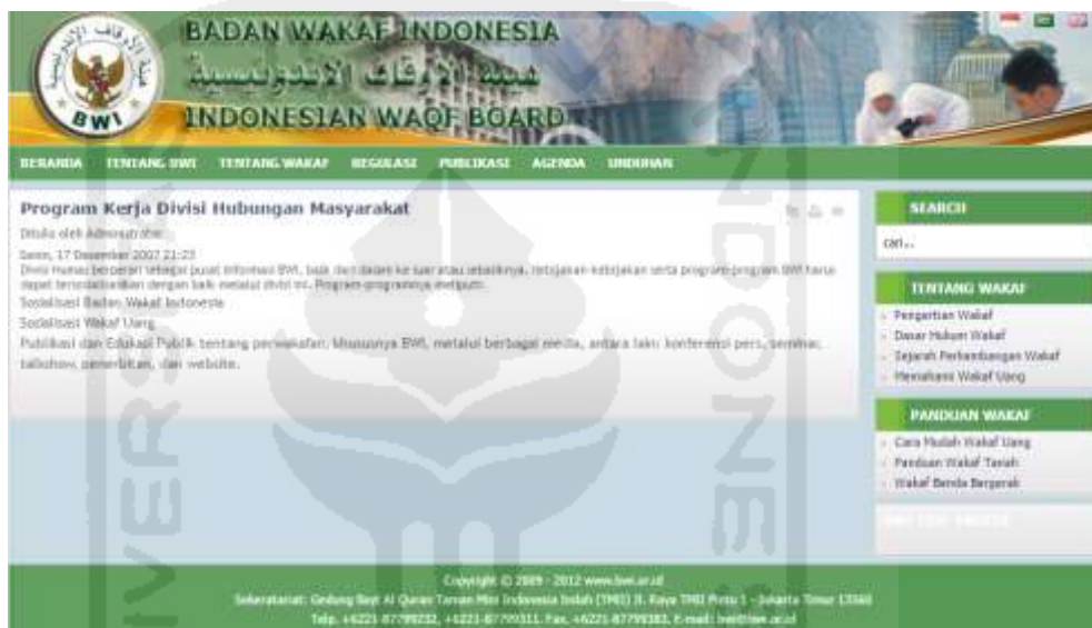
Gambar 4.3 Program Kerja Divisi Hubungan Masyarakat Badan Wakaf Indonesia