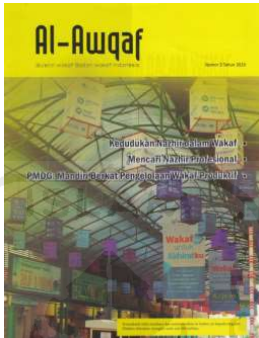
Gambar 4.5 Buletin Al-Awqaf

Untuk pemanfaatan media cetak koran sendiri, divisi Hubungan Masyarakat Badan Wakaf Indonesia memaksimalkan nya dengan membuat artikel terkait dengan wakaf uang, dimana sosialisasi yang dilakukan dikemas dalam bentuk Advetorial di koran republika. Untuk pemberdayaan koran sendiri Badan Wakaf Indonesia sudah tidak memprioritaskan untuk digunakan dalam mensosialisasikan wakaf uang, dikarenakan biaya yang sangat mahal, yang berdampak terhadap anggaran dan pemahaman masyarakat yang kurang dikarenakan sosialisasi yang dilakukan tidak bersifat terus-menerus (Wawancara, Nurkaib, 2016).