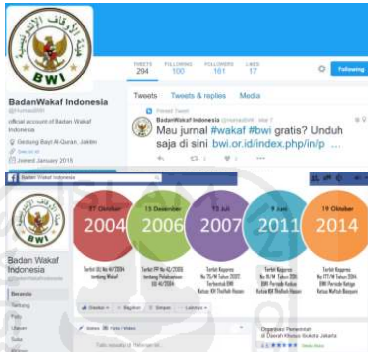
Gambar 4.7 Akun Resmi Media Sosial Facebook dan Twitter