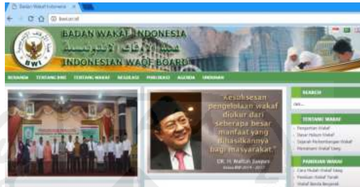
Gambar 4.6 Halaman Website Resmi Badan Wakaf Indonesia

informasi mengenai wakaf uang yaitu regulasi wakaf uang, cara berwakaf tunai, nazir wakaf uang, lembaga keuangan syariah pengelola wakaf uang, dan e-book yang berisi tentang jurnal dan buletin tentang wakaf uang.