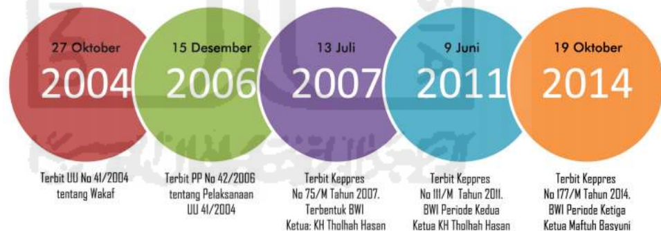
Gambar 4.1 Masa Perkembangan Wakaf di Indonesia

Pendapatan yang di peroleh dari pengelolaan wakaf tersebut dapat di belanjakan untuk berbagai tujuan yang berbeda-beda, seperti keperluan pendidikan, kesehatan, pemberdayaan ekonomi masyarakat, untuk pemeliharaan harta-harta wakaf, dan lain-lain.