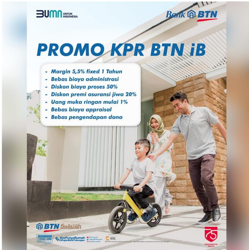
Lampiran 2: Brosur Pembiayaan