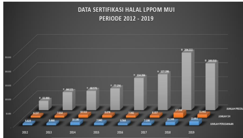
Gambar 2. Data sertifikasi halal produk di Indonesia tahun 2012-2019