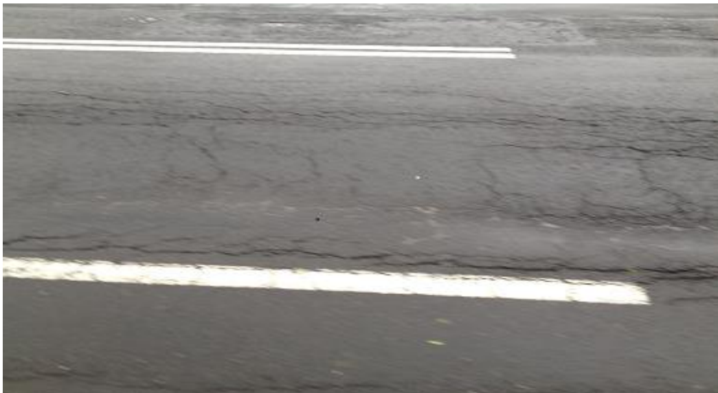
Gambar 1.2 Jenis Kerusakan Deformasi di ruas jalan Amol Mononutu, Ternate