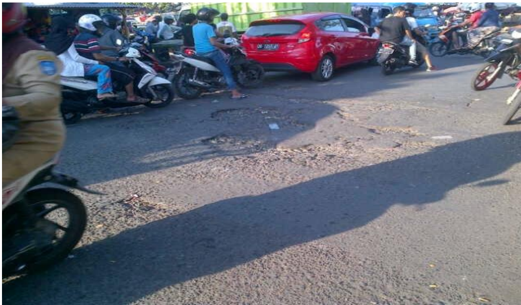
Gambar 1.1 Jenis Kerusakan Retak di ruas jalan Amol Mononutu, Ternate

Pada beberapa titik di ruas Jalan Amol Mononutu, Ternate ke arah Selatan, terdapat permukaan yang mengalami kerusakan yang cukup parah seperti permukaan yang bergelombang, alur ( rutting ), dan lubang. Kerusakan yang terjadi di lokasi penelitian dapat dilihat pada Gambar 1.1 dan Gambar 1.2 berikut.