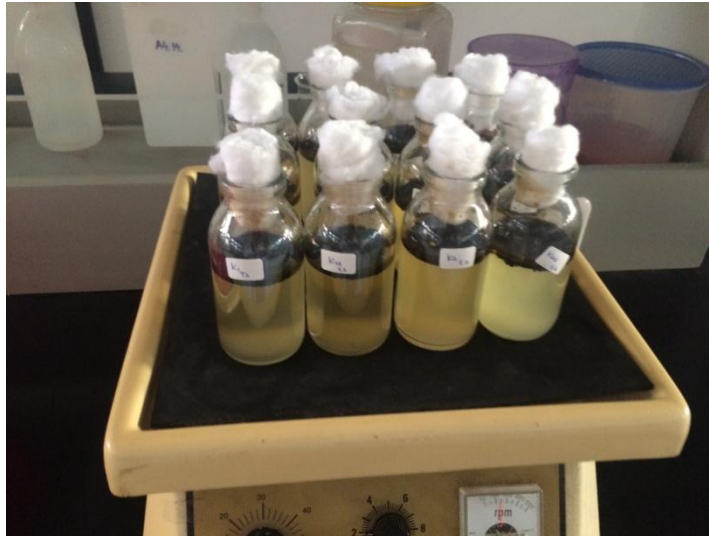
Lampiran 4. Reaktor di letakkan pada Orbital Shaker setiap harinya