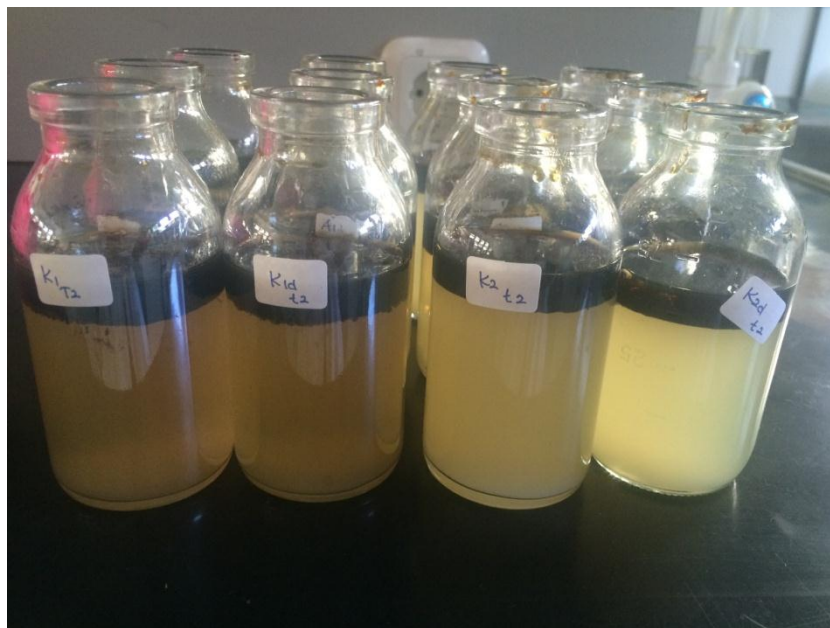
Lampiran 5. Reaktor diberi n-hexane untuk uji TPH