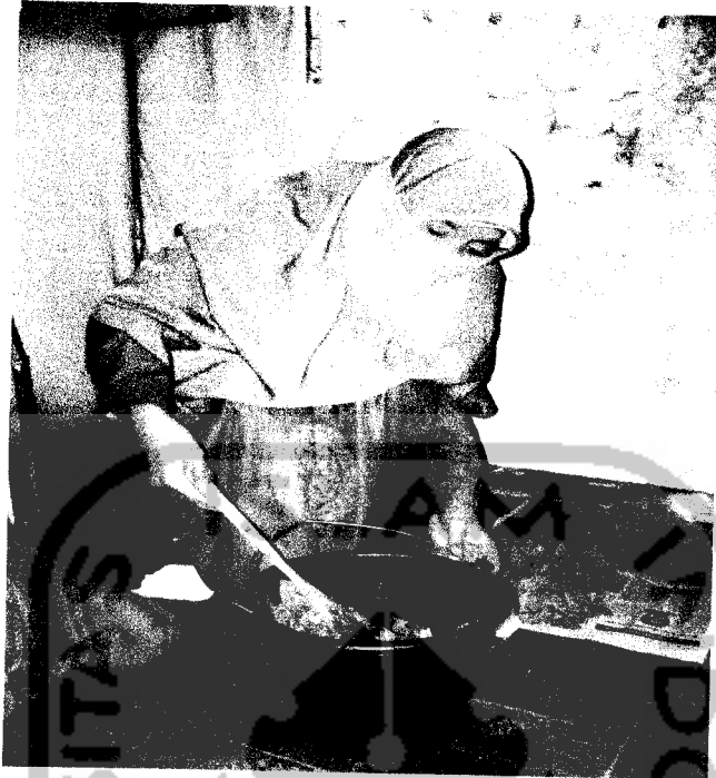
Gambar 3.9 Proses pengadukan bahan sebelum pengomposan