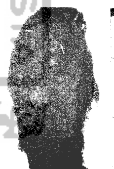
Gambar 3.3 (Tanah biasa)