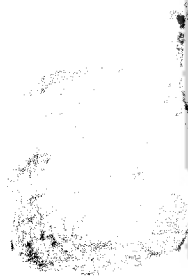
Gambar 3.1 (Tinja Manusia)

Pada penelitian ini bahan yang digunakan adalah tinja manusia, tanah biasa, dan daun-daunan kering. Bahan – bahan penelitian ini dapat dilihat pada gambar di bawah ini :