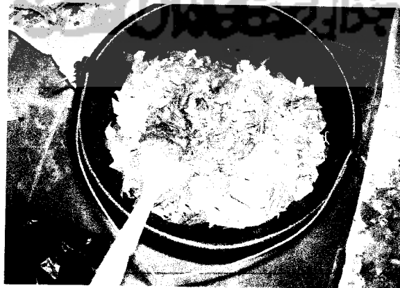
Gambar 3.8 Proses pencampuran bahan di dalam ember

Proses pembuatan kompos humanure dapat dilihat pada Gambar 3.8 dan 3.9 dibawah ini :