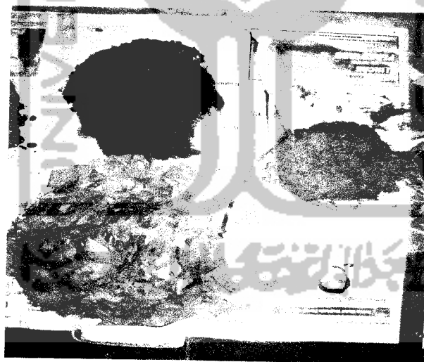
Gambar 3.7 Proses persiapan bahan untuk pengomposan