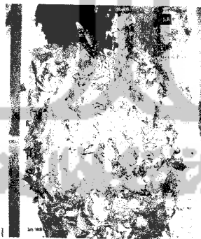
Gambar 3.2 (Daun-daunan kering)