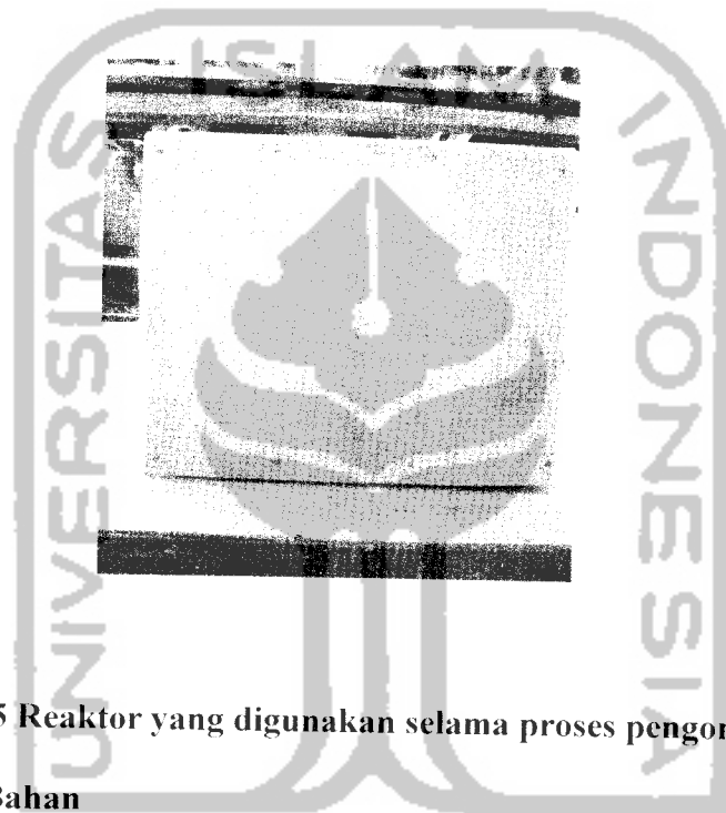
Gambar 3.5 Reaktor yang digunakan selama proses pengomposan

Wadah yang digunakan pada penelitian ini adalah wadah kayu yang terbuat dari triplek berbentuk kubus tanpa penutup dengan panjang 20 cm, lebar 20 cm, dan tinggi 20 cm. Dinding reaktor dibuat berlubang agar proses aerobik dapat berjalan sebagaimana mestinya. Gambar reaktor dapat dilihat pada Gambar 3.5 :