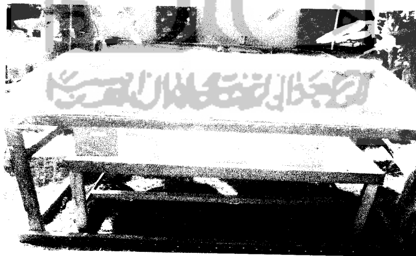
Gambar 3.4 Rumah kaca

Rumah kaca dibuat untuk menjaga kelembaban dan menjaga kompos dari gangguan manusia dan binatang seperti anjing, kucing, ayam dan lain sebagainya serta menjaga kompos dari hujan lebat. Rumah kaca dibuat dengan atap dari bahan plastik transparan agar cahaya matahari tetap dapat masuk serta dilengkapi dengan dinding yang dibuat dari kain strimin untuk mengatur sirkulasi udara agar proses pengomposan berjalan secara aerobik. Adapun rumah kaca tersebut dapat dilihat pada Gambar 3.4 dibawah ini :