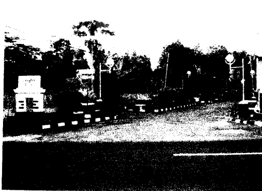
Gb.Jalan masuk ke Perum.Tugu Asri

Disekitar site sudah terdapat area pemukiman penduduk yang padat. Ini dapat dilihat dengan adanya banyak perumahan yang berada di area sekitar site. Di bagian utara site terdapat perumahan Tugu Asri dan pada bagian selatan site terdapat pemukiman penduduk yang sudah padat, sehingga suasana di sekitar kawasan ini teratur dan tidak kacau.