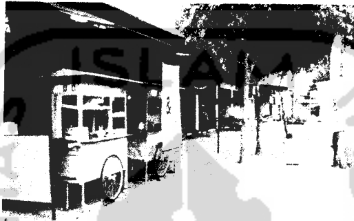
Gb.I. Sentra Industri Kecil di Timur Site