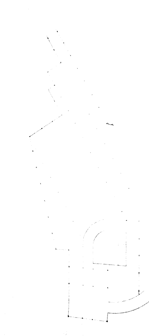
- denah basement