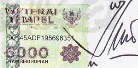
Wahyu Mijil Sampurno