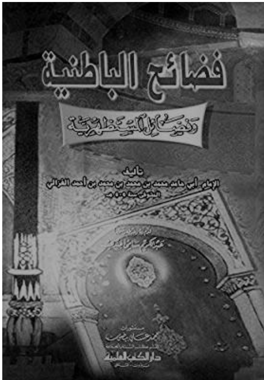
Sampul kitab Fadhā'ih al-Bāṭiniyyah wa Fadhā'il al-Mustazhiriyyah karya Imam al-Ghazali.