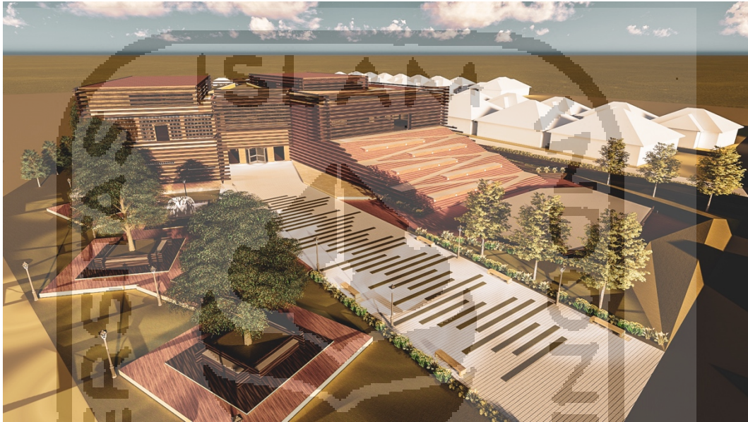
Gambar 6.1 Mukaan Bangunan

Pada mukaan bangunan sudah memberikan satu kesatuan utuh kepada penikmat dan pengguna bangunan. Dengan pemberian aksent kayu yang horizontal kepada seluruh mukaan bangunan. Hal tersebut bertujuan untuk memberikan rasa megah dan unik.