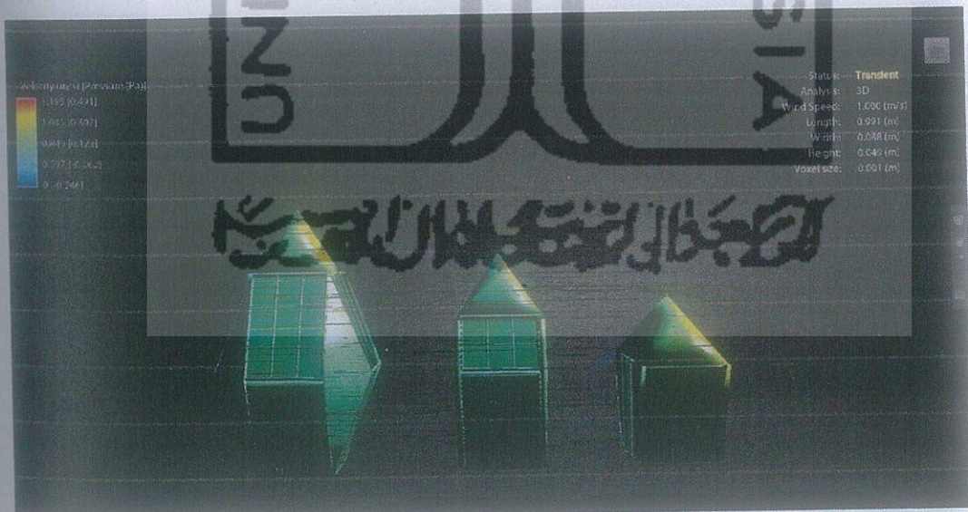
Gambar 5.2 Uji desain flow desain (2)