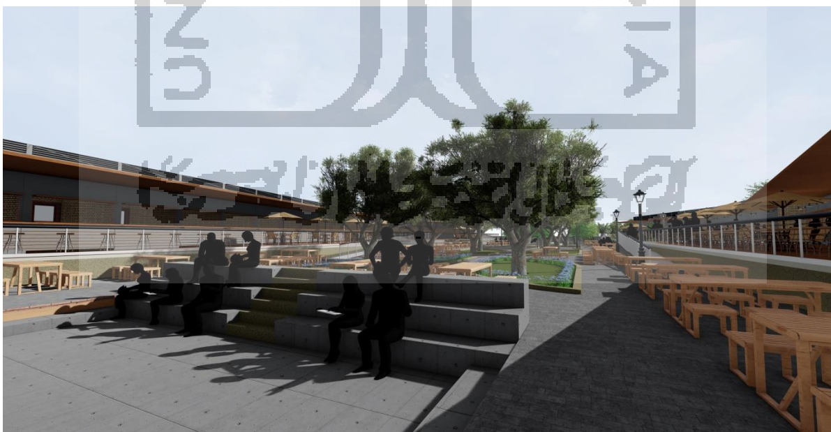
Kegiatan Ruang Publik