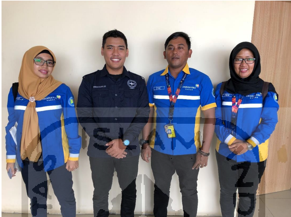
Bersama Pembimbing Lapangan