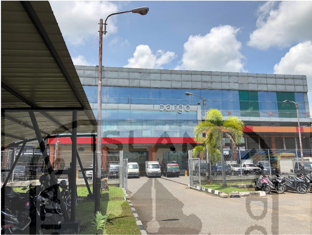
Kantor PT Angkasa Pura Kargo