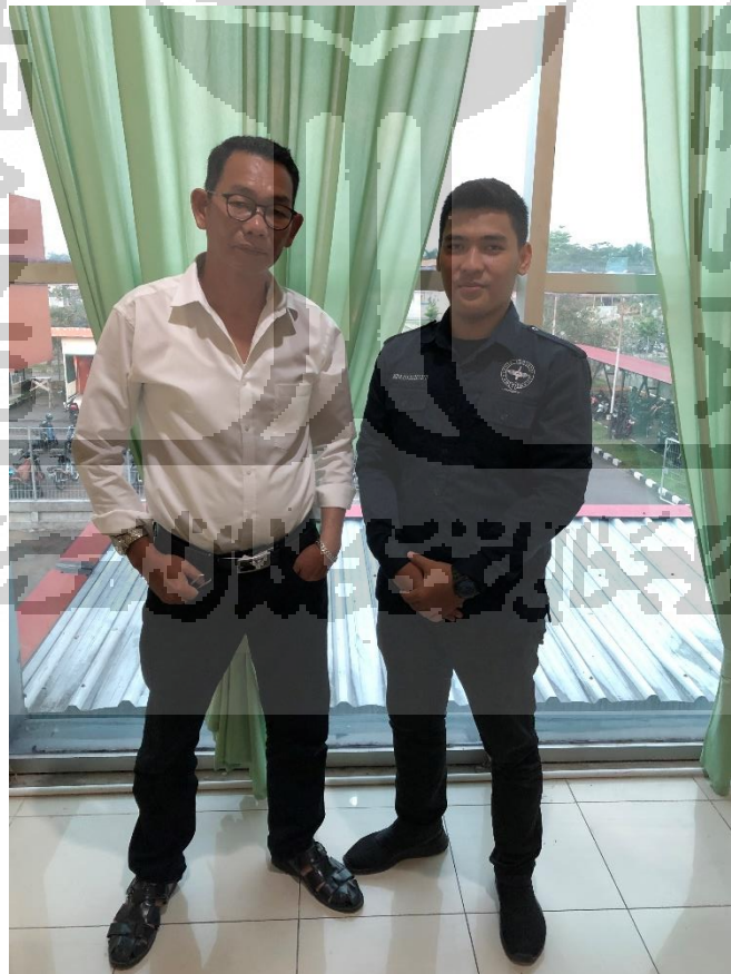
Bersama Pimpinan PT Angkasa Pura Kargo Cabang Pontianak