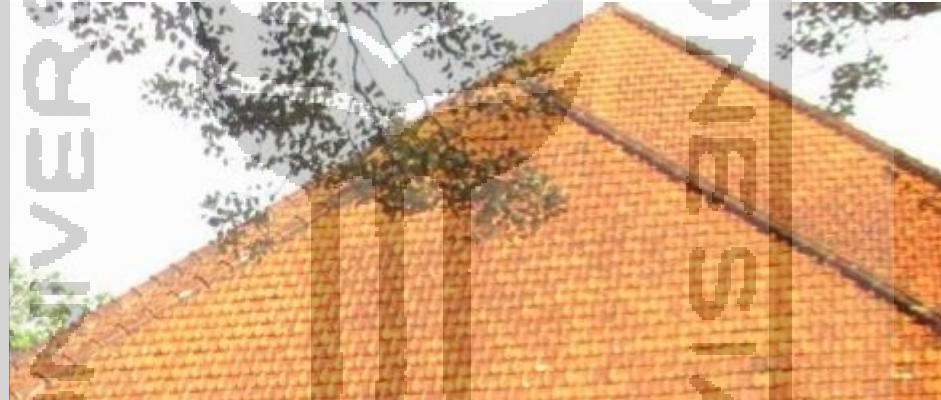
Gambar 5.2 Arahannya Material Atap

Untuk penutup atap berupa 9limasan atau pelana dengan beton cor sebaiknya menggunakan material genteng tanah liat, cenderung memiliki warna atap coklat kemerahan.