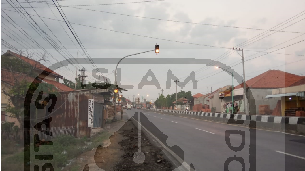
Rambu Lampu Hati – Hati