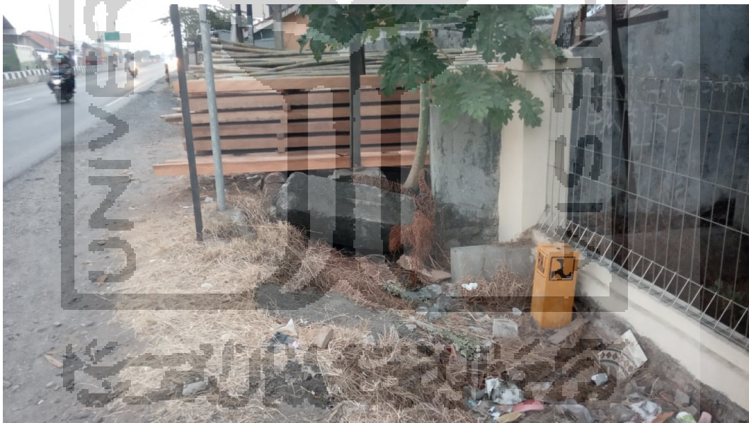
Patok Ruang Milik Jalan