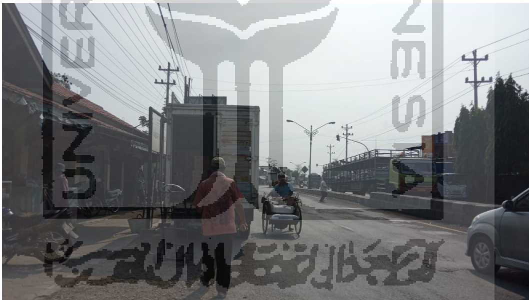
Kondisi Hambatan Samping Berupa Pasar