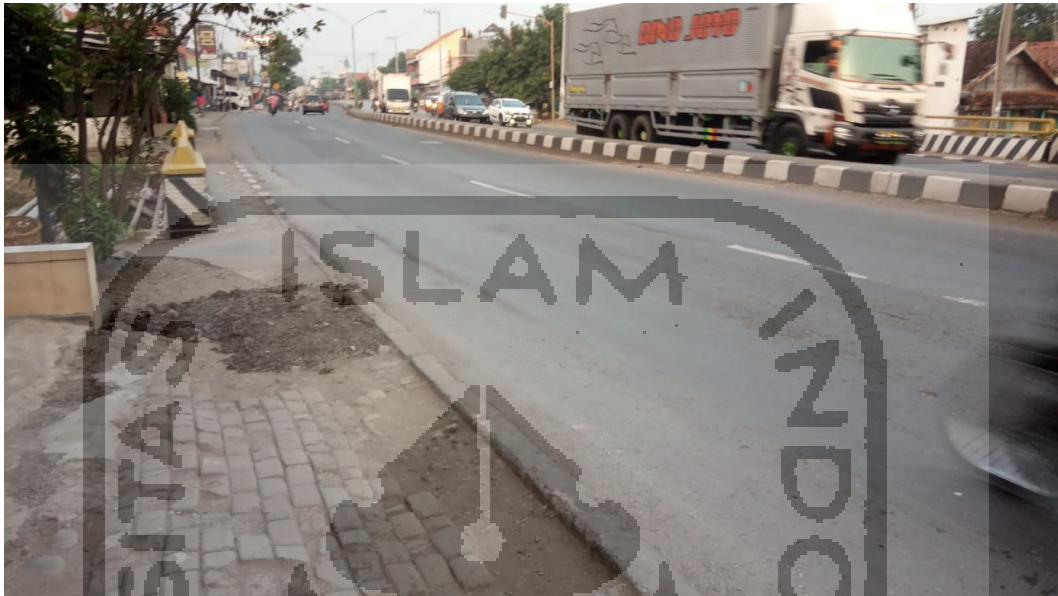
Kondisi Tikungan Arah Barat Ke Timur