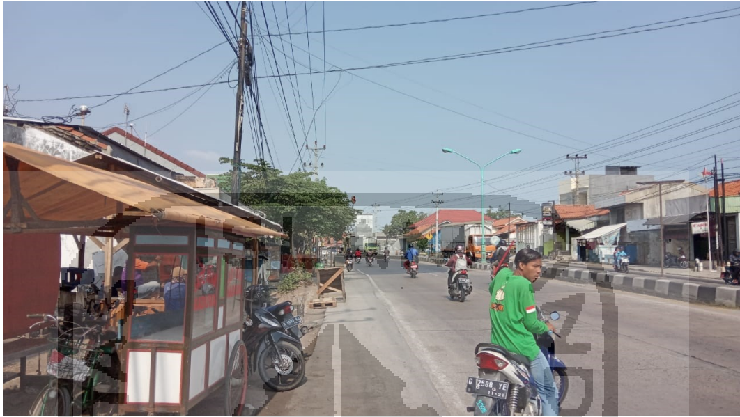
Kondisi Pengguna Jalan