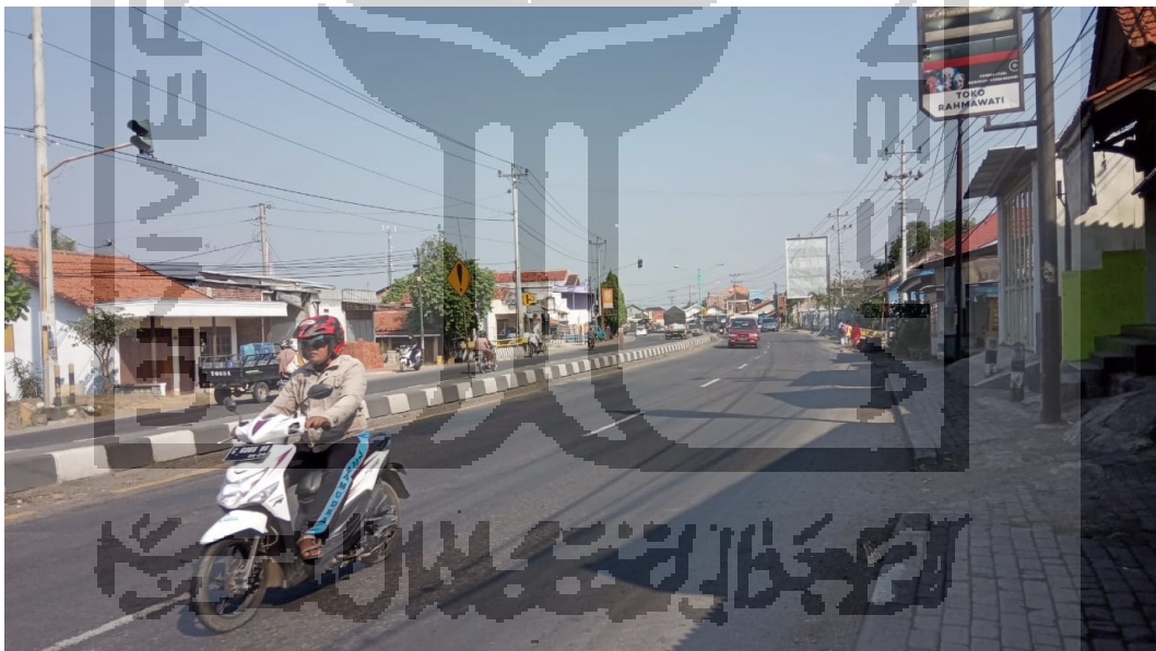
Kondisi Tikungan Arah Timur Ke Barat