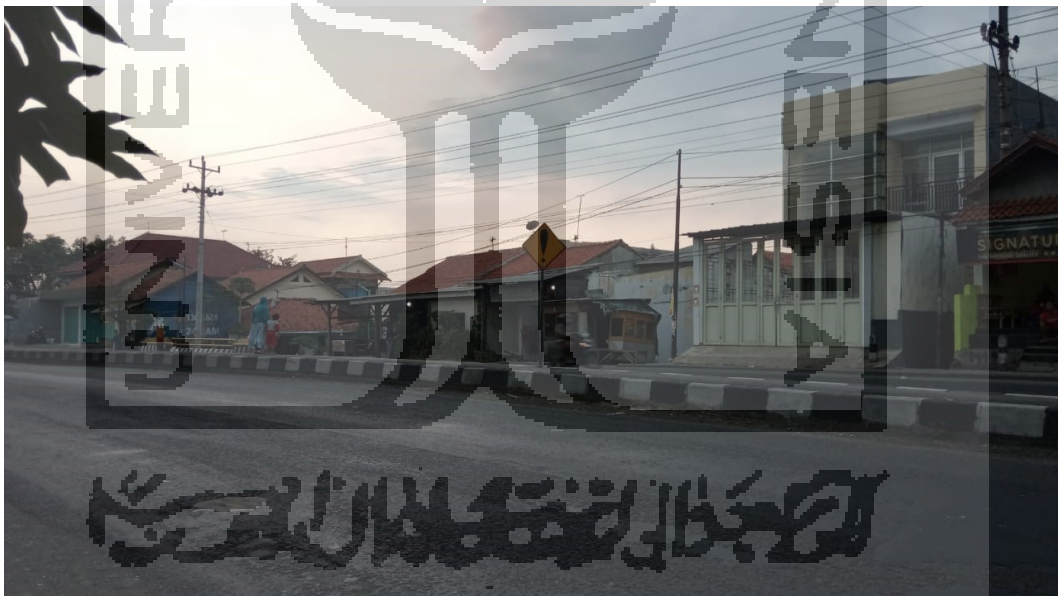
Rambu Hati – Hati