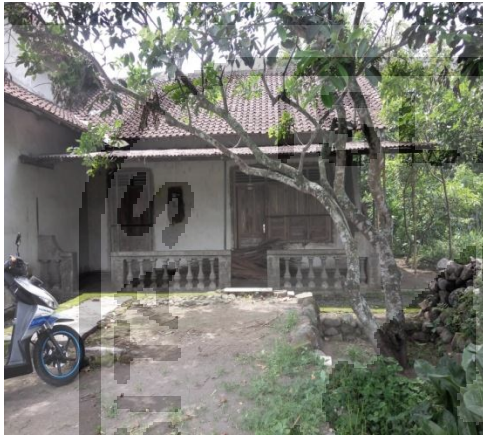
Foto informan ke 1