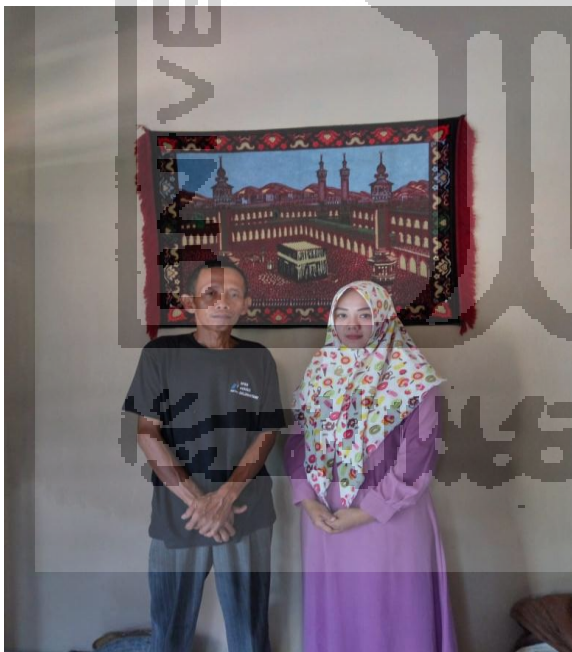
Foto informan ke 2