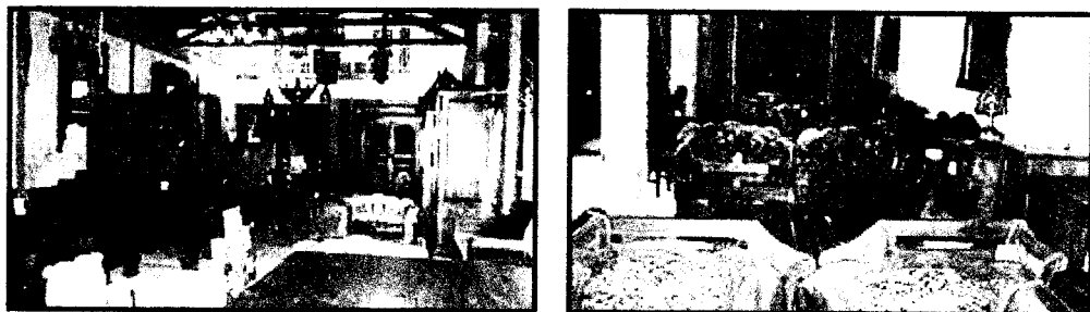
Gambar 2.7 : Showroom 2 dan Showroom 6