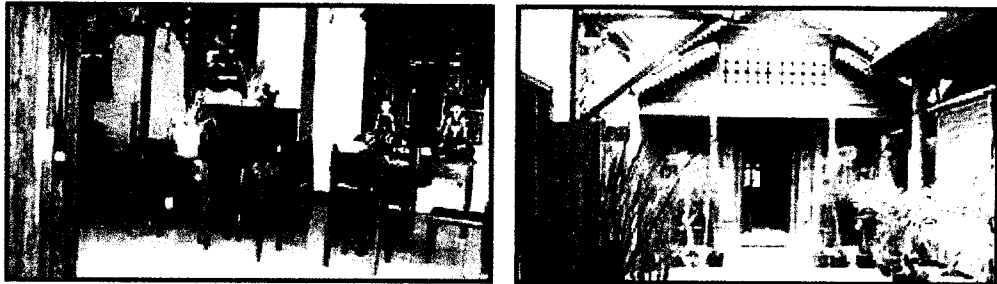
Gambar 2.7 : Kantor dan Showroom 1