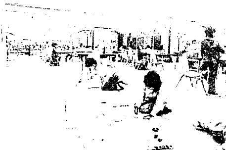
Gambar 3.7 Penurunan lantai sebagai tempat membaca

Kegiatan Berkreatifitas bagi anak dapat dimana saja dan dapat dimulai disebuah tempat berkumpulnya banyak buku