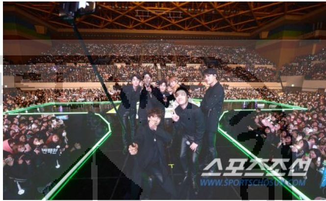
Gambar 6 Boygroup EXO

Bangkok atau Korea Selatan. Dan akan menyelenggarakan fanmeeting di Indonesia pada tanggal 26 Mei 2019. ( www.instagram.com/naturerepublic.id )