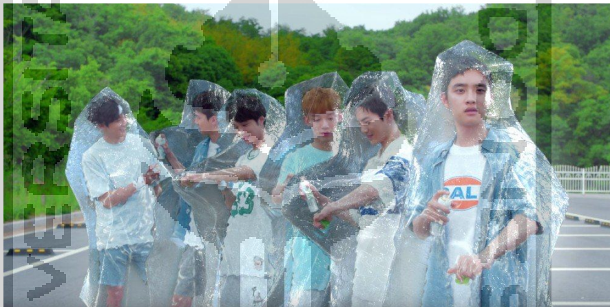
Gambar 4 Boygroup EXO