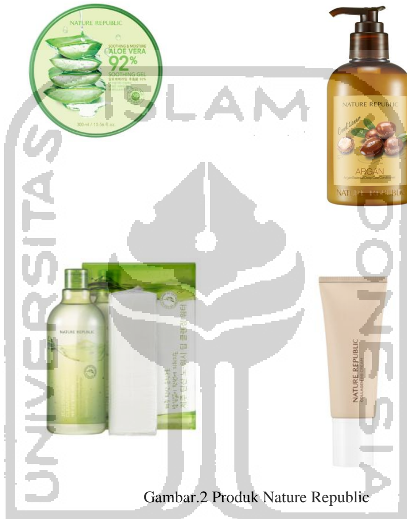
Gambar.2 Produk Nature Republic

produk yang terdapat dalam website Nature Republic yang masuk dalam kategori best seller