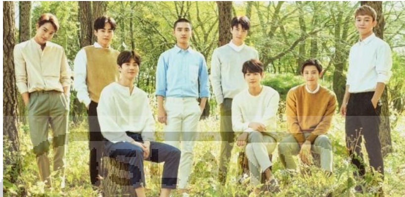
Gambar 3 Boygroup EXO