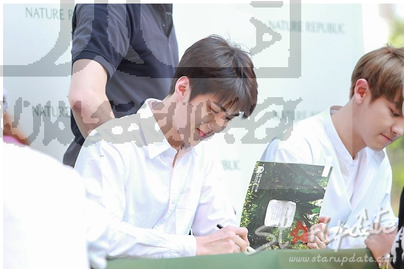
Gambar 7 Fansign EXO

Para penggemar EXO bisa mendapatkan tanda tangan dan berjabat tangan secara langsung dengan semua member EXO. Sistem yang digunakan perusahaan ini biasanya Top Spender (belanja produk paling banyak) atau bisa juga Lucky Draw (Undian). ( www.instagram.com/naturerepublic.id )