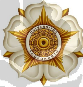
Gambar 2.1 Logo Universitas Gadjah Mada

Setiap perusahaan memiliki visi dan misi yang menjadi dasar dari pekerjaan mereka. Universitas Gadjah Mada mempunyai visi sebagai pelopor perguruan tinggi nasional berkelas dunia yang unggul dan inovatif, mengabdikan kepada kepentingan bangsa dan kemanusiaan dijiwai nilai-nilai budaya bangsa berdasarkan Pancasila, serta misi untuk Menjalankan pendidikan, penelitian, dan pengabdian kepada masyarakat serta pelestarian dan pengembangan ilmu yang unggul dan bermanfaat bagi masyarakat.