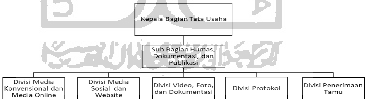
Tabel 2.2 Struktur Organisasi Humas Universitas Islam Negeri Sunan Kalijaga