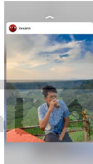
Gambar 2.7

Responden berumur 19 Tahun dan saat ini responden berkuliah di Jurusan Teknik Mesin di Universitas Negri Padang. Responden tertarik dengan isu lingkungan yang ada di Indonesia. Akhirnya tahu tentang akun @wwf_id di Instagram di explore .