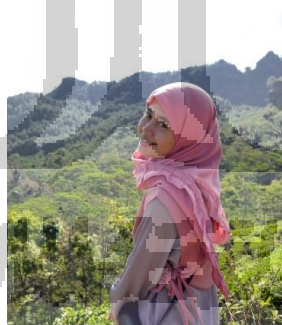
Gambar 2.3

Responden adalah seorang mahasiswa tingkat akhir di Jurusan Sosiologi UGM. Responden ber umur 21 Tahun. Saat ini responden sedang menyelesaikan tugas akhirnya. Responden adalah seorang yang senang