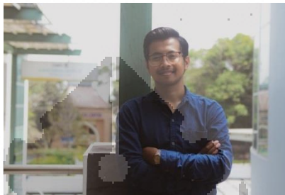
Gambar 2.4

Responden adalah seorang mahasiswa tingkat akhir jurusan psikologi di Universitas Islam Indonesia. Saat ini responden berusia 23 tahun. Responden memiliki pengalaman dalam kegiatan perawatan lingkungan. Responden juga bercerita, pengalaman dan ilmu-ilmu tentang merawat lingkungan ia dapatkan di pergaulan sosialnya.