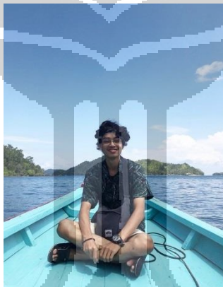
Gambar 2.6

Responden bercerita kalau ia mengikuti akun Instagram @wwf_id sebagai sarana mencari informasi tentang lingkungan serta hewan-hewan yang dilindungi dan hampir punah. Responden juga bercerita kalau ia sangat suka dengan Harimau. Harimau adalah hewan yang dilindungi di Indonesia, habitatnya terbatas.