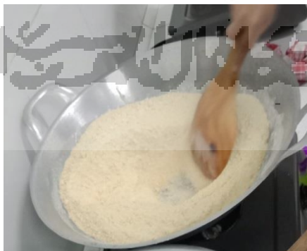
c. Proses pengeringan susu