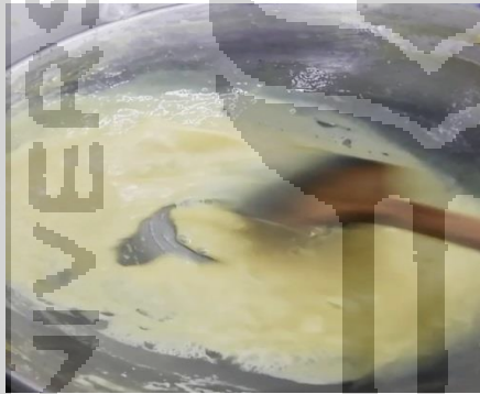
b. Proses pengentalan susu