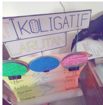
Gambar 7 Contoh Penugasan Presentasi Makalah Mapel Kimia

Berbeda dengan guru Kimia yaitu Ibu Merry yang menugaskan pembuatan makalah tentang molekul larutan kepada siswa-siswinya dengan bahan presentasi menggunakan barang bekas sebagai wujud mencintai lingkungan.