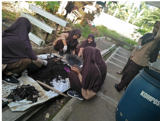
Gambar 6 Kegiatan Tim Kompos

“... tentu asyik dan menyenangkan, bisa belajar buat kompos yang hasilnya bisa jadi uang, dari sampah bisa jadi berkah. Kompos yang siap jual sudah dalam kondisi terplastik, biasanya dibeli oleh bapak ibu guru atau masyarakat petani...” 109