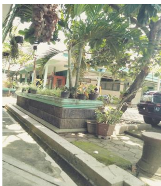
Gambar 2 Tanaman di Halaman Kelas

Tidak hanya dalam menanam tanaman sayur, tim Green House dibantu oleh siswa-siswi untuk menata dan menanam tanaman hias dan tanaman obat keluarga. Seperti bunga anggrek, tanduk rusa, ketapang biola, pohon sawo kecil dan lainnya.