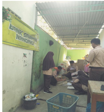
Gambar 4 Kegiatan Tim Bank Sampah

Kegiatan pilah sampah oleh tim Bank Sampah dilakukan setiap hari Jum'at pukul 07.00-08.00 WIB. Hari Jum'at adalah hari yang diperingati sebagai Hari Lingkungan Hidup MAN 2 Kulon Progo.