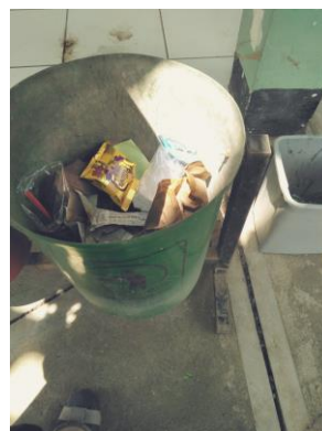
Gambar 5 Tong Sampah Yang Tercampur

Tantangan yang dihadapi oleh Tim Bank Sampah adalah ketika sampah yang ada dalam tong sampah yang sudah dibedakan jenis sampahnya, namun tercampur satu dengan yang lainnya. Sehingga mereka harus memilah sampah sesuai dengan jenisnya masing-masing.