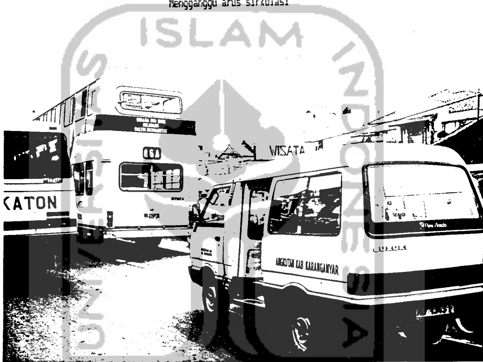
Kemacetan yang ditimbulkan bis-bis yang berhenti didepan pasar