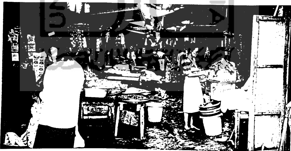
Selasar yang digunakan untuk berjualan sepersempit sirkulasi pembeli