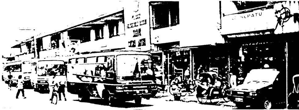
Angkutan-angkutan yang berhenti di depan pasar