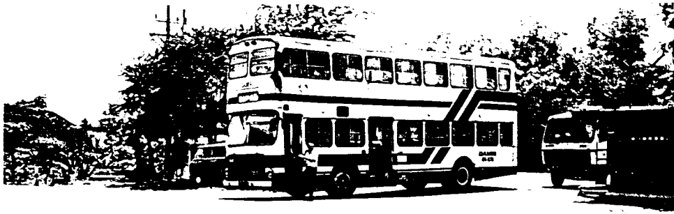
Bis yang mulai berangkat kearah Solo kosong tanpa penumpang (jauh perumahan dan angkutan lain)