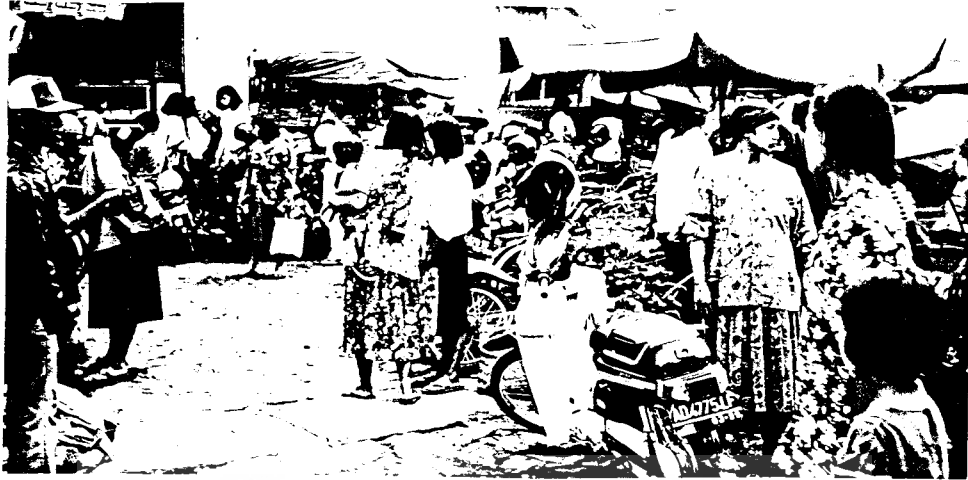
Daerah parkir yang dimanfaatkan untuk berjualan.