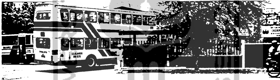
Bis yang masuk ke garasi tempat bis Daar berakhir sepi tanpa penumpang juga