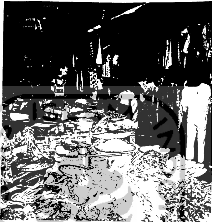
Penataan pasar yang beraur antara pakaian dan sayuran, tidak enak dipandang