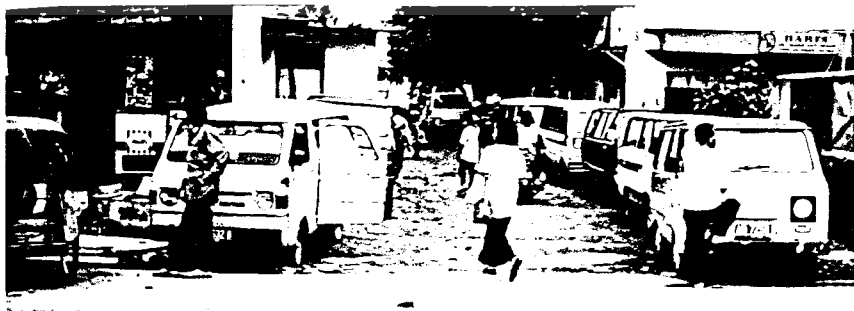
Angkutan yang menuju perumahan berhenti disamping pasar mengurangi kelancaran sirkulasi