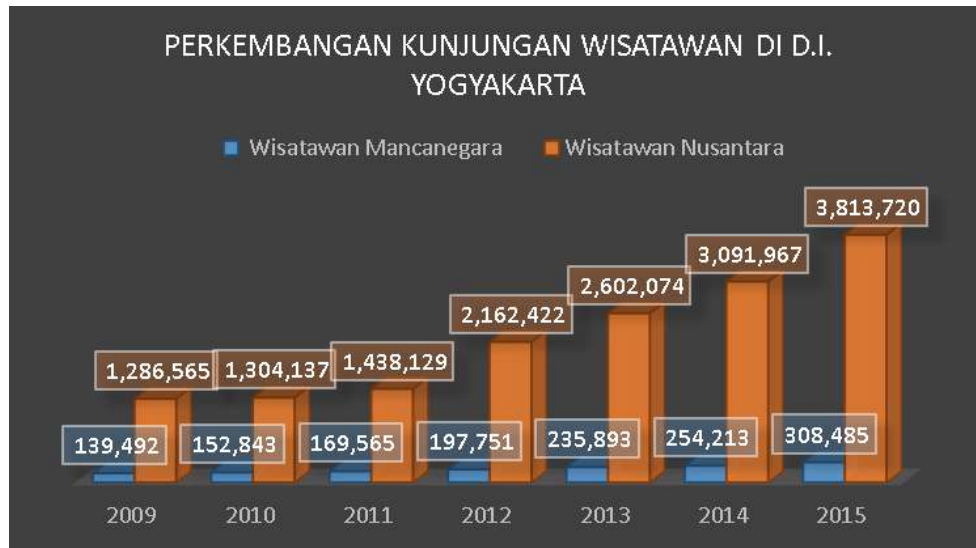
Gambar 1. Perkembangan Kunjungan Wisatawan di DIY