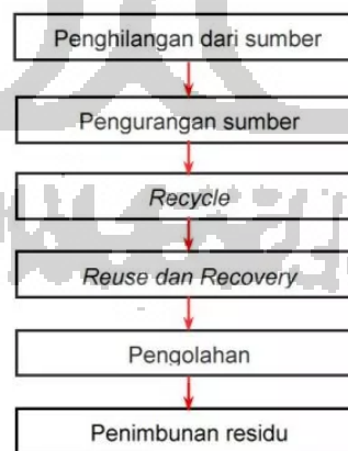
Gambar 2.1 Diagram Alir Prioritas Dalam Meminimalisasi Limbah

Banyak industri yang ingin mengurangi jumlah limbahnya, tetapi tidak mengetahui bagaimana memulai dan mengimplementasikan ke dalam permasalahan yang kompleks. Untuk mencapai sasaran tersebut perlu dilakukan prioritas dalam pelaksanaannya. Pada kondisi ideal penghilangan limbah secara total adalah merupakan sesuatu yang memungkinkan. Urutan prioritas untuk meminimalisasi limbah yang dihasilkan dapat dilihat melalui Gambar 2.1 berikut: